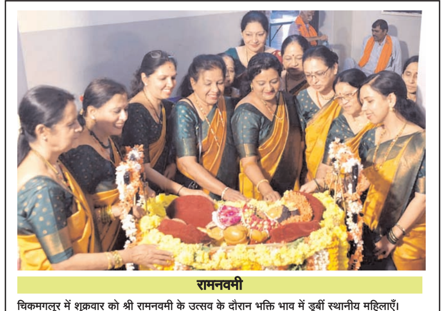
चिकमगलूरु में शुक्रवार को श्री रामनवमी के उत्सव के दौरान भक्ति भाव में डूबीं स्थानीय महिलाएँ।