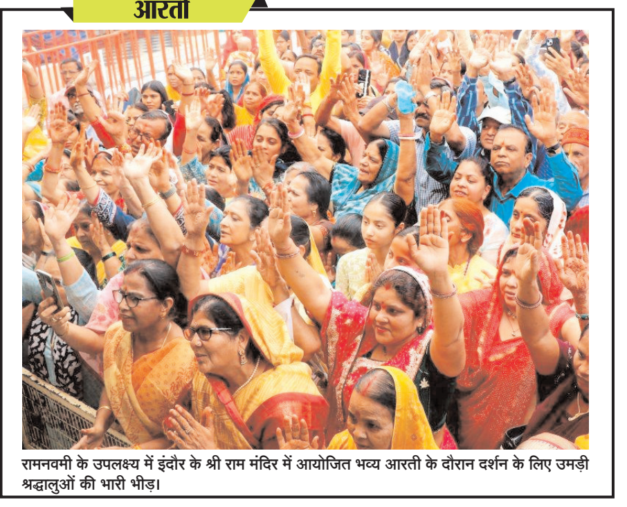
रामनवमी के उपलक्ष्य में इंदौर के श्री राम मंदिर में आयोजित भव्य आरती के दौरान दर्शन के लिए जमड़ी श्रद्धालुओं की भारी भीड़।

बजट से दोगुनी कमाई कर ली है। धुरंधर-2 अभी 'दंगल' और 'बाहुबली-2' का आंकड़ा छूने में काफी पीछे है। 'दंगल' ने 2070 करोड़ रुपये का वर्ल्ड वाइड कलेक्शन किया था, जबकि भारत में कुल नेट कलेक्शन 388 करोड़ रहा। 'धुरंधर-2' कुल नेट कलेक्शन के मामले में फिल्म को पछाड़ चुकी है, लेकिन ग्लोबल स्तर पर टकराव देने के लिए फिल्म को और मेहनत करनी पड़ेगी। वहीं 'बाहुबली-2' ने वर्ल्ड वाइड कलेक्शन 1788 करोड़ का किया और भारत में फिल्म का नेट कलेक्शन 1030 करोड़ रहा।