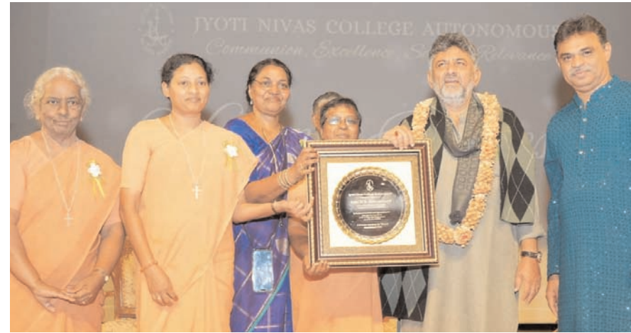
शुक्रवार को बंगलूरु में ज्योति निवास कॉलेज की 60वीं सालगिरह उपमुख्यमंत्री डीके शिवकुमार ने उद्घाटन किया।

जा सकते। उन्होंने कहा, इसके बाद, उन्होंने दिशानिर्देशों का पालन किया। टिकट मांगना कोई गलत बात नहीं है, लेकिन यह तय करना केएससीए और रॉयल चैलेंजर्स बंगलूरु (आरसीबी) पर निर्भर है कि पास या टिकट कैसे वितरित किए जाएं। जब उनसे कैबिनेट फेरबदल पर आम सहमति की कमी और उपचुनावों के बाद विधायकों के दिवंगतों की योजना बनाने की खबरों के बारे में पूछा गया, तो परमेश्वर ने कहा, यह सच है कि विधायकों ने रात्रिभोज बैठकें आयोजित की हैं और दिवंगतों में मिलने का समय मांगा है। उन्हें ऐसा करने का अधिकार है। मुख्यमंत्री सिद्धरामय्या पहले ही विधानसभा में कह चुके हैं कि सभी 224 विधायक मंत्री बनने के योग्य हैं, और जो उपयुक्त पाए जाएं, उन्हें अवसर दिए जाएंगे। आंतरिक आरक्षण को लेकर चल रहे आंदोलन पर उन्होंने कहा कि समुदायों का न्याय के लिए विरोध प्रदर्शन करना स्वाभाविक है। उन्होंने कहा, सरकार कानून के दायरे में रहकर अंतिम निर्णय लेगी। उनकी मांगों की जांच सामाजिक न्याय के सिद्धांतों के आधार पर की जाएगी। उन्होंने यह भी स्पष्ट किया कि कानूनी धिताओं के कारण विशेष कैबिनेट बैठक स्थगित कर दी गई थी। उन्होंने कहा, मुख्यमंत्री और मुख्य सचिव ने कानूनी स्थिति की जांच की। यहां तक कि कैबिनेट में हुई चर्चाएं भी, यदि सार्वजनिक कर दी जाएं, तो मतदाताओं को प्रभावित कर सकती हैं और चुनाव आयोग के दिशानिर्देशों का उल्लंघन कर सकती हैं।