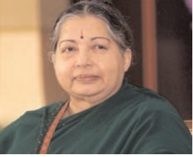
चेन्नई। ग्रेटर चेन्नई में महिला पुलिस कांस्टेबल का कथित रूप से रौन उप्पीडन किए जाने पर यातायात पुलिस के आईपीएस अधिकारी को निलंबित कर दिया गया है।