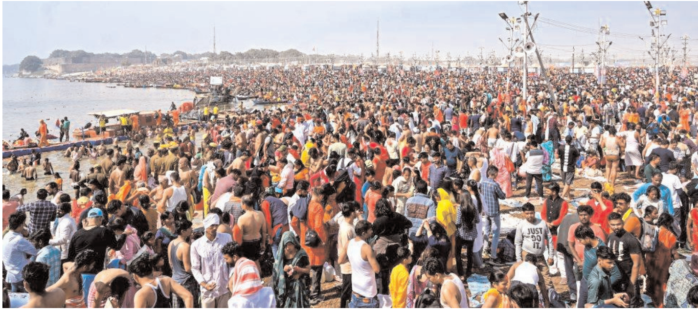
प्रयागराज में चल रहे महाकुंभ मेला के दौरान, गंगा, यमुना और पौराणिक सरस्वती नदियों के संगम, त्रिवेणी संगम पर पवित्र स्नान करने के लिए बड़ी संख्या में श्रद्धालु एकत्रित हुए।