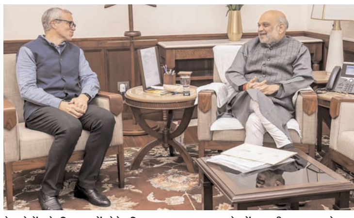
के लोगों को विश्वास में लेने की जरूरत बताई और कहा कि लोगों के प्रतिनिधि के तौर पर उनकी सरकार को कानून-व्यवस्था बनाए रखने में अपनी बात कहने का अधिकार होना चाहिए। शाह के कार्यालय ने 'एक्स' पर कहा,

दक्षिण भारत राष्ट्रमत dakshinbharat.com नई दिल्ली/भाषा। जम्मू-कश्मीर के मुख्यमंत्री उमर अब्दुल्ला ने केंद्रीय गृह मंत्री अमित शाह से सोमवार को मुलाकात की और शाह के साथ केंद्र शासित प्रदेश में कानून-व्यवस्था से संबंधित विभिन्न मुद्दों एवं औद्योगिक तथा पर्यटन नीतियों में बदलाव पर चर्चा की। अधिकारियों ने बताया कि दोनों नेताओं के बीच बैठक 30 मिनट तक चली। उन्होंने बताया कि मुख्यमंत्री ने शाह को हाल की दो घटनाओं - जम्मू के कटुआ में एक व्यक्ति की आत्महत्या और उत्तरी कश्मीर के सोपोर में एक ट्रक चालक के जांच चौकी पर नहीं रुकने पर उसे गोली मारने की घटना के बाद जम्मू-कश्मीर की स्थिति के बारे में जानकारी दी। चार और पांच फरवरी को हुई इन घटनाओं के बाद मुख्यमंत्री ने कहा था कि इस तरह की घटनाओं से 'उन लोगों के अलग-थलग पड़ने का खतरा है, जिन्हें हमें सड़क पर सामान्य स्थिति बनाने के लिए अपने साथ लेकर चलना चाहिए।' उमर अब्दुल्ला ने 'एक्स' पर एक पोस्ट में कहा था, 'मैंने इन घटनाओं को केंद्र सरकार के समक्ष उठाया है और कहा है कि दोनों घटनाओं की समयबद्ध और पारदर्शी तरीके से जांच की जाए। जम्मू-कश्मीर सरकार भी इन घटनाओं की जांच का आदेश देगी।' अधिकारियों ने बताया कि सोमवार को हुई बैठक के दौरान ऐसा माना जा रहा है कि मुख्यमंत्री ने गृह मंत्री को केंद्र शासित प्रदेश के लोगों को विश्वास में लेने की जरूरत बताई और कहा कि लोगों के प्रतिनिधि के तौर पर उनकी सरकार को कानून-व्यवस्था बनाए रखने में अपनी बात कहने का अधिकार होना चाहिए। शाह के कार्यालय ने 'एक्स' पर कहा,