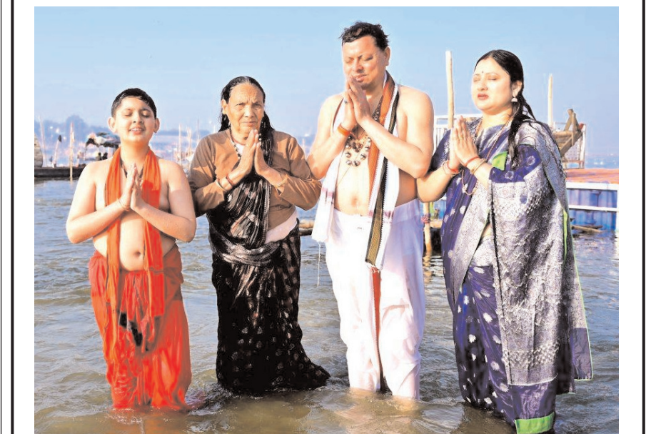
उत्तराखंड के मुख्यमंत्री पुष्कर सिंह धामी, परिवार के साथ, प्रयागराज में चल रहे महाकुंभ मेला के दौरान त्रिवेणी संगम में पवित्र स्नान करते हुए।