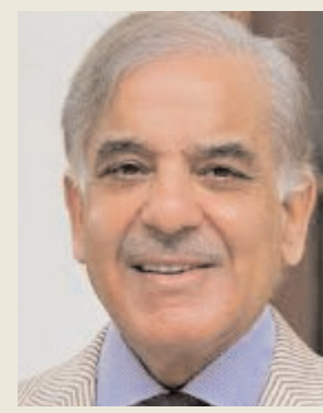
की टीम को पूरे देश का समर्थन हासिल है।"

शरीफ ने कहा, "हमारी टीम बहुत अच्छी है और उसने हाल के दिनों में अच्छा प्रदर्शन किया है लेकिन उनके सामने अब वास्तविक चुनौती चैंपियंस ट्रॉफी जीतना ही नहीं बल्कि दुबई में होने वाले मैच में हमारे घिर प्रतिद्वंद्वी भारत को हराना होगा। पाकिस्तान