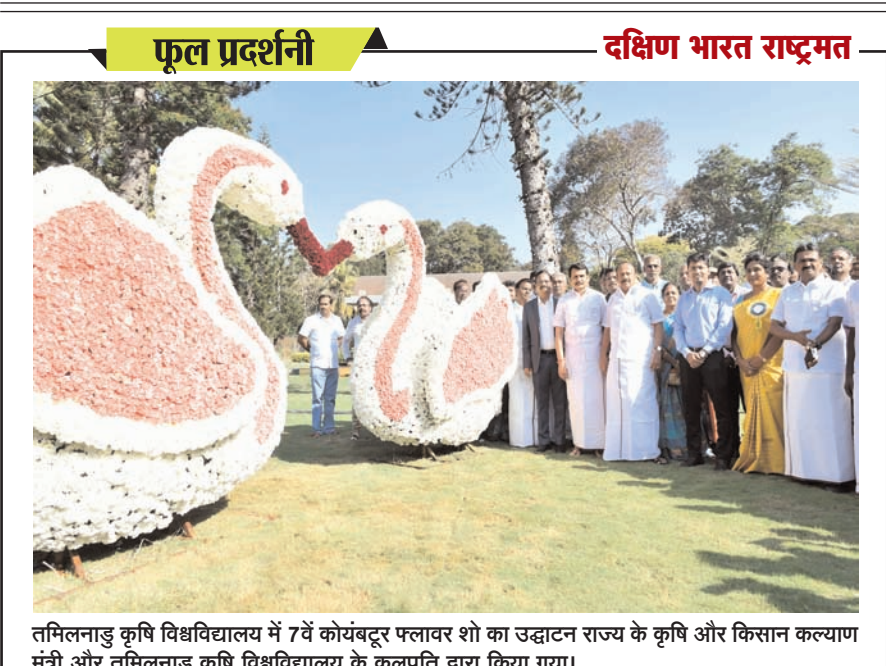
तमिलनाडु कृषि विश्वविद्यालय में 7वें कोयंबटूर फ्लायर शो का उद्घाटन राज्य के कृषि और किसान कल्याण मंत्री और तमिलनाडु कृषि विश्वविद्यालय के कुलपति द्वारा किया गया।