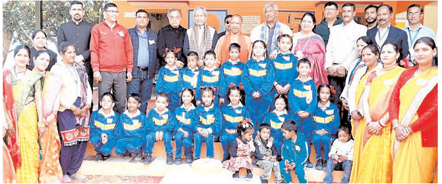
उत्तर प्रदेश के मुख्यमंत्री योगी आदित्यनाथ, उत्तराखंड के मुख्यमंत्री पुष्कर सिंह धामी के साथ, शनिवार को पौड़ी गढ़वाल के थांगर में सरकारी प्राथमिक विद्यालय में एक कार्यक्रम के दौरान स्कूल विकास परियोजना का उद्घाटन किया।