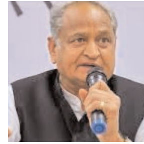
के बाद सही तरीके से लागू नहीं किया गया। गहलोत ने गुरुवार को यहां कहा कि उन्हें जयपुर के रेहड़ी-पटरी विक्रेता यूनियन के

जयपुर। राजस्थान के पूर्व मुख्यमंत्री अशोक गहलोत ने कहा है कि वर्ष 2014 में तत्कालीन संयुक्त प्रगतिशील गठबंधन (संग्रम) सरकार के दौरान रेहड़ी-पटरी वालों को विशेष क्षेत्र तय करके वहां पकड़ी जागह देने के उद्देश्य से पथ विक्रेता अधिनियम बनाया गया था, जिसे राष्ट्रीय जनतांत्रिक गठबंधन (एनडीए) सरकार के केंद्र में आने