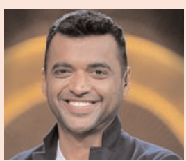
दक्षिण भारत राष्ट्रमत dakshinbharat.com

शेखरधारकों को लिखे एक पत्र में कहा, "हमारे बोर्ड ने आज इस बदलाव को मंजूरी दी है और मैं अपने शेयरधारकों से भी इस बदलाव का समर्थन करने का अनुरोध करता हूँ। अगर इसे मंजूरी मिल जाती है, तो हमारी कॉर्पोरेट वेबसाइट का पता 'जोमैटो डॉट कॉम' से बदलकर 'इंटरनेल डॉट कॉम' हो जाएगा।" उन्होंने बताया कि इंटरनेल में अभी चार प्रमुख व्यवसाय शामिल होंगे - जोमैटो, ब्लिंकित, डिस्ट्रिक्ट और हाइपरप्योर। उन्होंने कहा, "जब हमने ब्लिंकित का अधिग्रहण किया, तो हमने कंपनी और ब्रांड/एप के बीच अंतर करने के लिए आपस में जोमैटो की जगह इंटरनेल का इस्तेमाल शुरू कर दिया था। हमने यह भी सोचा कि जिस दिन जोमैटो के अलावा कुछ भी हमारे भविष्य का एक महत्वपूर्ण चालक बन जाएगा, हम सार्वजनिक रूप से कंपनी का नाम बदलकर इंटरनेल कर देंगे।"