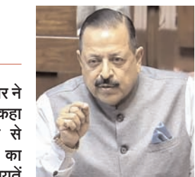
दक्षिण भारत राष्ट्रमत dakshinbharat.com

नई दिल्ली/भाषा। सरकार ने बृहस्पतिवार को राज्यसभा में कहा कि पिछले साल 28 लाख से अधिक जन शिकायतों का निपटारा किया गया। ये शिकायतें केंद्रीयकृत लोक शिकायत निवारण और निगरानी प्रणाली (सीपीग्राम्स) पर प्राप्त हुईं।