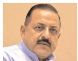
चंद्रमा की सतह से नमूने एकत्र करेगा और उन्हें पृथ्वी पर लाना है।"

सिंह ने पीटीआइ-वीडियो को दिए एक साक्षात्कार में कहा, "चंद्रयान-4 मिशन का लक्ष्य