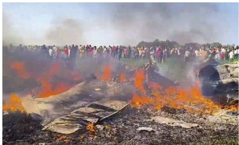
मध्यप्रदेश के शिवपुरी जिले में

बरेहमपुर/भाषा। ओडिशा के गंजाम जिले में काले हिरणों की संख्या बढ़कर 8,789 हो गई है। वन विभाग के एक अधिकारी ने यह जानकारी दी। अधिकारी ने बताया कि वन विभाग की ओर से 29 जनवरी को जिले के तीनों वन प्रभागों में कराई गई द्विदिवसीय गणना में काले हिरणों की कुल संख्या 8,789 दर्ज की गई। वर्ष 2023 में गंजाम में काले हिरणों की संख्या 7,745 और 2018 में 4,082 आंकी गई थी। नवीनतम गणना के अनुसार, जिले में मौजूद कुल काले हिरणों में 5,241 मादा, 1,765 नर और 1,783 अव्यक्त काले हिरण शामिल हैं। वन्यजीव (संरक्षण) अधिनियम, 1972 (संशोधित 1992) के तहत काले हिरणों को अनुसूची-1 में रखा गया है और इसे रेड डेटा बुक में "संकटग्रस्त" श्रेणी में सूचीबद्ध किया गया है।