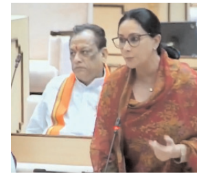
आधार पर इसका संचालन किया जाए।

उन्होंने कहा कि इस मिड वे को आउट सोर्स पद्धति पर फिर से चालू किए जाने का मामला विचाराधीन है। इसमें सरकार इस बात पर भी विचार कर रही है कि इस मिड वे को प्राइवेट सेक्टर में लीज पर दिया जाए अथवा ऑपरेशन एंड मेंटीनेंस