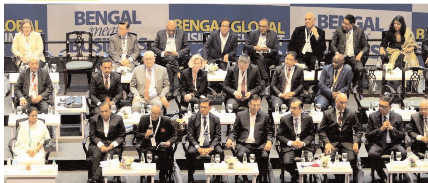
पश्चिम बंगाल की मुख्यमंत्री ममता बनर्जी बुधवार को कोलकाता में बंगाल ग्लोबल बिजनेस समिट (बीजीबीएस) को संबोधित करती हुईं।