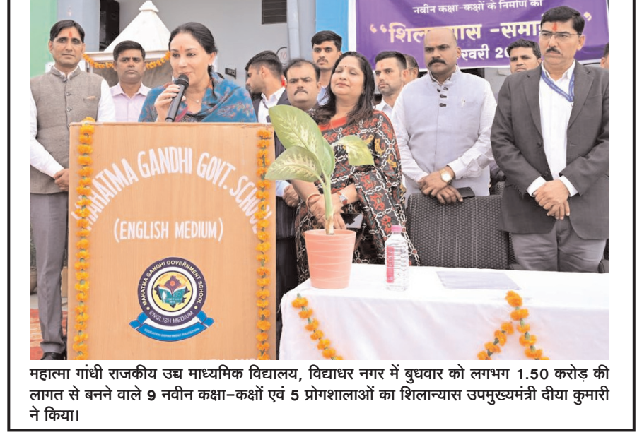
महात्मा गांधी राजकीय उच्च माध्यमिक विद्यालय, विद्याधर नगर में बुधवार को लगभग 1.50 करोड़ की लागत से बनने वाले 9 नवीन कक्षा-कक्षों एवं 5 प्रोग्रामलाओं का शिलान्यास उपमुख्यमंत्री दीया कुमारी ने किया।