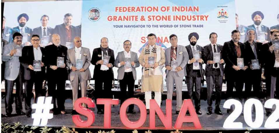
स्टोना 2025 प्रदर्शनी की बुकेलेट का विमोचन करते हुए मुख्य अतिथि व फिम्सी के पदाधिकारी।