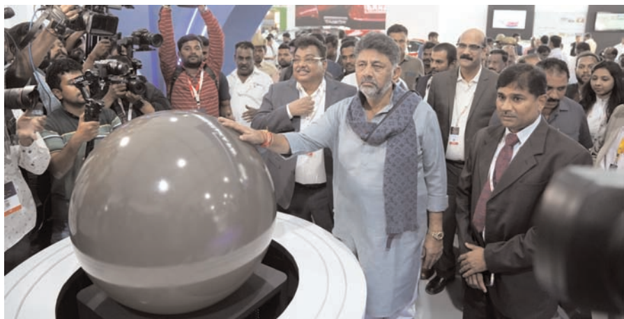
बंगलूरु के पैलेस ग्राउन्ड में बुधवार को 'शिखर सम्मेलन इन्वेस्ट कर्नाटक-2025' सम्मेलन में भाग लेते हुए उपमुख्यमंत्री डीके शिवकुमार, बड़े और मध्यम उद्योग एम बी पाटिल और अन्य। इस मौके पर एयर टैक्सी स्टॉल और अन्य स्टॉलों का विशिष्टजनों ने दौरा किया।