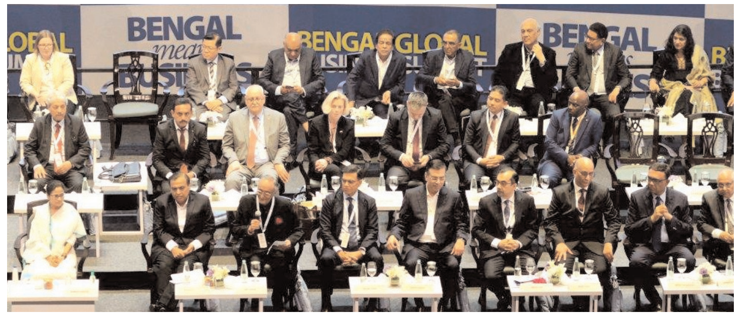
पश्चिम बंगाल की मुख्यमंत्री ममता बनर्जी बुधवार को कोलकाता में बंगाल ग्लोबल बिजनेस समिट (बीजीबीएस) को संबोधित करती हुईं।