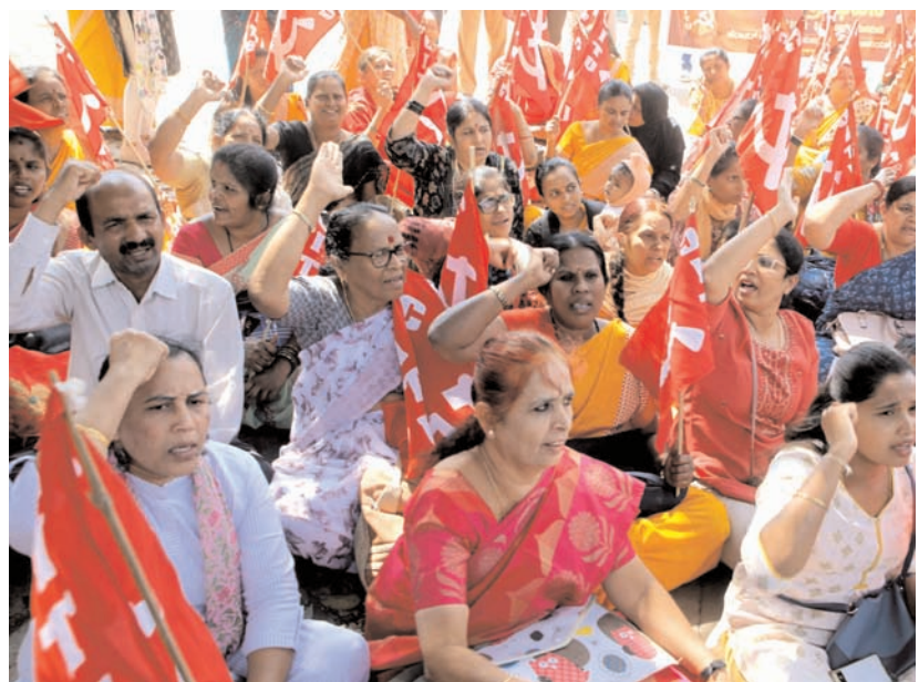
सेंटर ऑफ इंडियन ट्रेड यूनियन (सीआईटीयू) के सदस्यों ने बुधवार को बंगलूर के फ्रीडम पार्क में कथित जनविरोधी केंद्रीय बजट के खिलाफ विरोध प्रदर्शन किया।