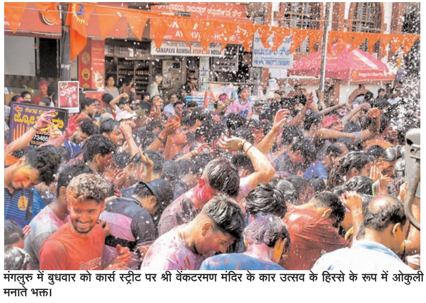
मंगलूर में बुधवार को कार्स स्ट्रीट पर श्री वेंकटरमण मंदिर के कार उत्सव के हिस्से के रूप में ओकुली मनाते भक्त।