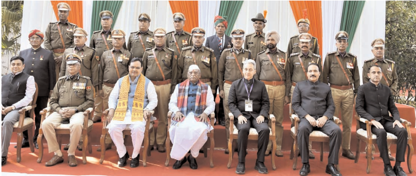
राज्यपाल हरिभाऊ बागडे और मुख्यमंत्री भजन लाल शर्मा ने उदयपुर में गणतंत्र दिवस समारोह की पूर्व संध्या पर सहैलियों की बाड़ी में आयोजित राज्य स्तरीय समारोह में शनिवार को 'एट होम' कार्यक्रम में भाग लिया। इस दौरान उन्होंने कला, साहित्य और विभिन्न अन्य क्षेत्रों में उल्लेखनीय कार्य करने वाली प्रतिभाओं का सम्मान भी किया।