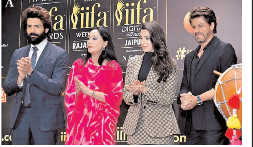
शनिवार को भारतीय फिल्म उद्योग के प्रतिष्ठित 25वें आईफा अवार्ड समारोह की मेजबानी राजस्थान के जयपुर को मिलने पर आज मुंबई में प्रेस वार्ता के माध्यम से पत्रकार बंधुओ को उपमुख्यमंत्री दीपा कुमारी ने संबोधित किया।