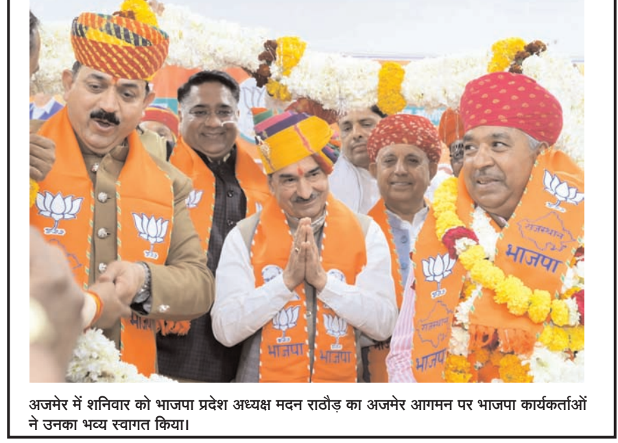
अजमेर में शनिवार को भाजपा प्रदेश अध्यक्ष मदन राठौड़ का अजमेर आमजन पर भाजपा कार्यकर्ताओं ने उनका भव्य स्वागत किया।