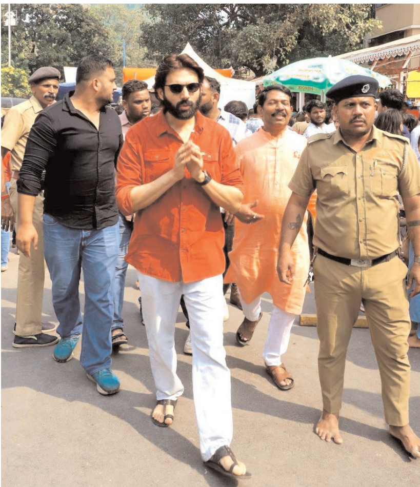
अभिनेता कार्तिक आर्यन ने नए साल के पहले दिन मुंबई में सिद्धिविनायक मंदिर में पूजा अर्चना की।