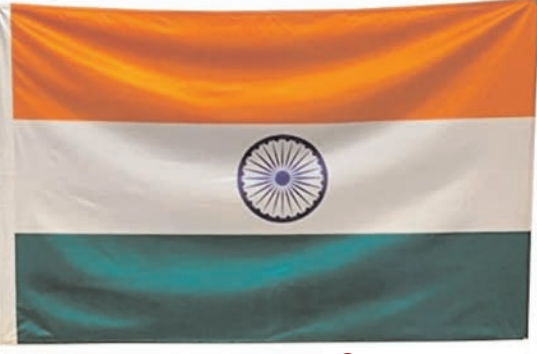
दक्षिण भारत राष्ट्रमत