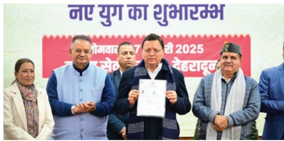
पोर्टल की शुरुआत की। पिछले विधानसभा चुनाव के दौरान भारतीय जनता पार्टी (भाजपा) ने यूसीसी लाने का वादा किया और इसकी शुरुआत के मौके पर राज्य मंत्रिमंडल के सदस्य, विधायक और अनेक नेता मौजूद थे। यूसीसी पोर्टल पर सबसे पहले

देहरादून/भाषा। उत्तराखंड में सोमवार को समान नागरिक संहिता (यूसीसी) लागू कर दी गयी जिसके साथ ही यह स्वतंत्र भारत में ऐसा करने वाला पहला राज्य बन गया है। यहां मुख्यमंत्री आवास में आयोजित एक कार्यक्रम में मुख्यमंत्री पुष्कर सिंह धामी ने अधिसूचना जारी कर यूसीसी को लागू किया। इस दौरान मुख्यमंत्री ने इसके क्रियान्वयन के लिए नियमावली तथा विवाह, तलाक, सहवर्सी संबंध के अनिवार्य आनलाइन पंजीकरण हेतु एक