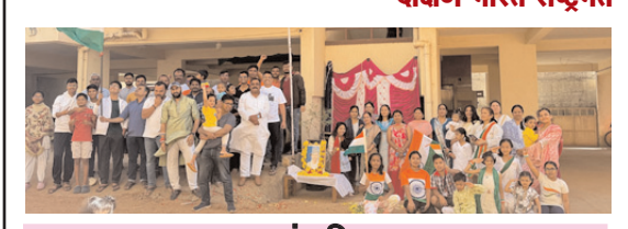
दक्षिण भारत राष्ट्रमत