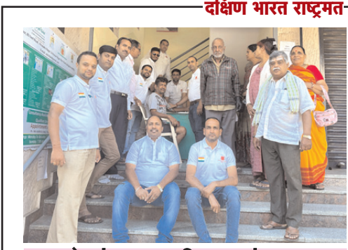
दक्षिण भारत राष्ट्रमत