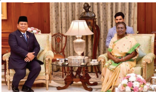
सांस्कृतिक संबंधों का भी उल्लेख किया और कहा कि जब भी वह भारतीय संगीत सुनते हैं तो उनके पैर धिरकने लगते हैं। सुबियांतो ने कहा कि वह कुछ दिनों के लिए भारत आए थे, लेकिन उन्होंने प्रधानमंत्री नरेन्द्र मोदी के नेतृत्व, कार्यकर्ता और गरीबी उन्मूलन की प्रतिबद्धता से बहुत कुछ सीखा। सुबियांतो ने प्रधानमंत्री मोदी की प्रशंसा करते हुए कहा, "हाशिप पर पड़े लोगों की मदद करने और समाज के सबसे कमजोर तबके की सहायता करने की आपकी (प्रधानमंत्री मोदी की) प्रतिबद्धता हमारे लिए प्रेरणा है...क्यों न एक अच्छे उदाहरण का अनुसरण किया जाए। खासकर तब जब आपके सामने कई अच्छे उदाहरण हों।"

सुबियांतो ने राष्ट्रपति भवन में राष्ट्रपति द्रौपदी मुर्मू द्वारा आयोजित रात्रिभोज में यह बात कही। इंडोनेशियाई राष्ट्रपति ने भारत के साथ अपने देश के