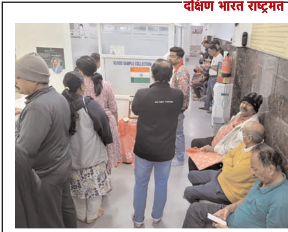
दक्षिण भारत राष्ट्रमत