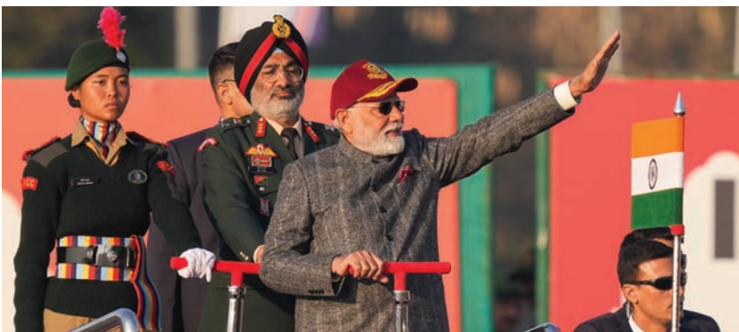
प्रधानमंत्री ने कहा कि लोकसभा और विधानसभा के चुनाव एक साथ करने से व्यवधान दूर हो सकते हैं और अधिक केंद्रित शासन दृष्टिकोण को अमल में लाया जा सकता है।

राजधानी दिल्ली स्थित के करिअपा परेड मैदान में राष्ट्रीय कैडेट कोर (एनसीसी) की वार्षिक रैली को संबोधित करते हुए प्रधानमंत्री मोदी ने यह बात कही। उन्होंने कहा कि आजादी के बाद काफी समय तक लोकसभा और विधानसभा के