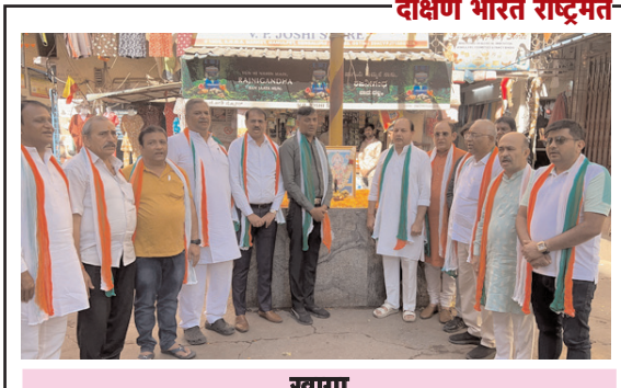
दक्षिण भारत राष्ट्रमत