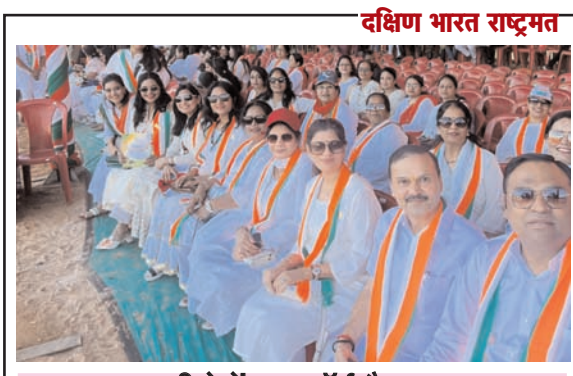
दक्षिण भारत राष्ट्रमत