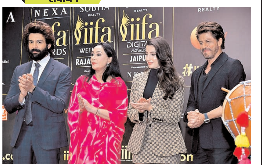
शनिवार को भारतीय फिल्म उद्योग के प्रतिष्ठित 25वें आईफा अवार्ड समारोह की मेजबानी राजस्थान के जयपुर को मिलने पर आज मुंबई में प्रेस वार्ता के माध्यम से पत्रकार बंधुओं को उपमुख्यमंत्री दीपा कुमारी ने संबोधित किया।