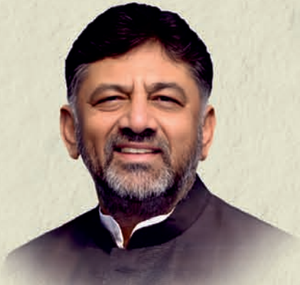
श्री डी.के. शिवकुमार माननीय उपमुख्यमंत्री

75 साल पहले इसी दिन भारत ने अपना संविधान अपनाया था और एक संप्रभु गणराज्य बना था। आज, हमारा गणतंत्र और हमारा संविधान खतरे में हैं। फासीवादी और विभाजनकारी ताकतें हमारे राष्ट्र के संघीय ढांचे और लोकतांत्रिक मूल्यों को कमजोर कर रही हैं। अब समय आ गया है कि हम अपने देश को एक संप्रभु गणराज्य बनाए रखने के लिए खुद को पुनः संविधान को समर्पित करें।