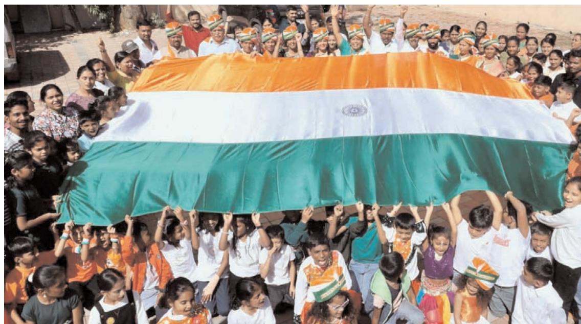
गणतंत्र दिवस की पूर्व संध्या पर शनिवार को बंगलूर में भारतीय विश्व संस्कृति संस्थान में छात्र तिरंगा फहराते हुए।