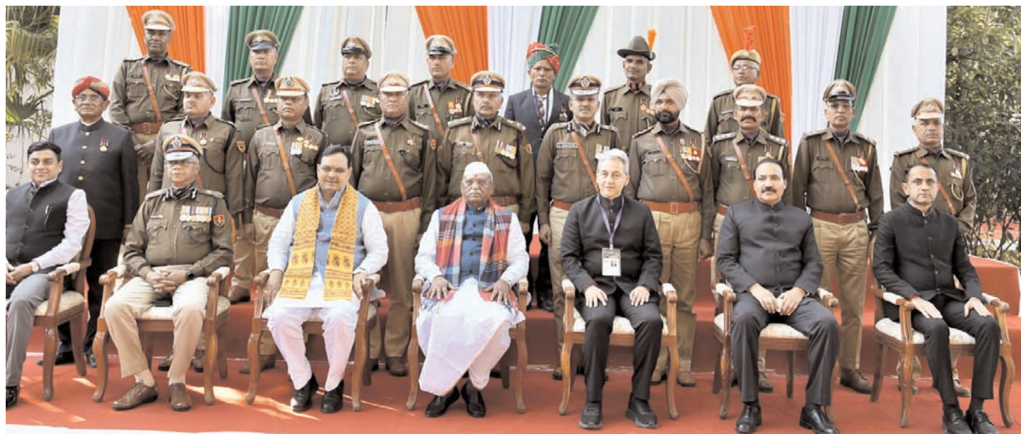
राज्यपाल हरिभाऊ बागड़े और मुख्यमंत्री भजन लाल शर्मा ने उदयपुर में गणतंत्र दिवस समारोह की पूर्व संध्या पर सहैलियों की बाड़ी में आयोजित राज्य स्तरीय समारोह में शनिवार को 'एट होम' कार्यक्रम में भाग लिया। इस दौरान उन्होंने कला, साहित्य और विभिन्न अन्य क्षेत्रों में उल्लेखनीय कार्य करने वाली प्रतिभाओं का सम्मान भी किया।