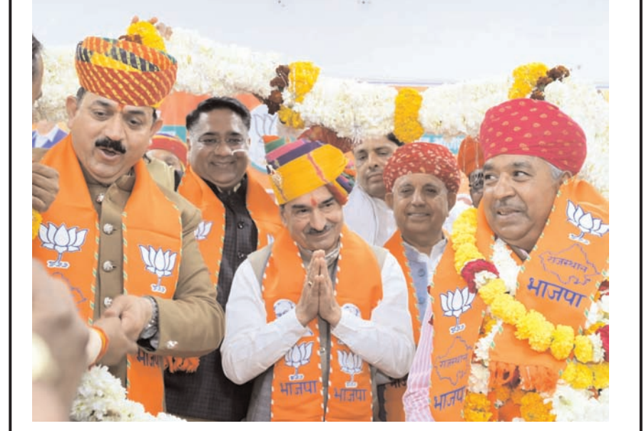
अजमेर में शनिवार को भाजपा प्रदेश अध्यक्ष मदन रावौड का अजमेर आमजन पर भाजपा कार्यकर्ताओं ने उनका भव्य स्वागत किया।