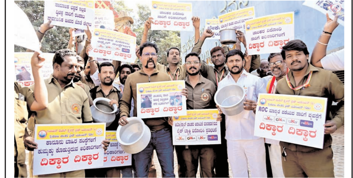
भारतीय वाहन चालक ट्रेड यूनियन के सदस्यों ने शनिवार को बंगलूर के फ्रीडम पार्क में विरोध प्रदर्शन किया और बाइक टैक्सियों पर प्रतिबंध लगाने की मांग की।