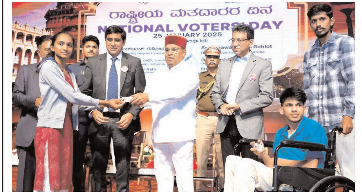
कर्नाटक के राज्यपाल थावर चंद गहलोत शनिवार को बंगलूर के टाउन हॉल में राष्ट्रीय मतदाता दिवस पर आयोजित एक कार्यक्रम के दौरान एक शारीरिक रूप से विकलांग व्यक्ति को मतदाता पहचान पत्र प्रदान करते हुए।