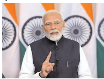
जाने में महत्वपूर्ण भूमिका निभाएगा।" बर्फौली सुहूह में खेलों इंडिया शीतकालीन खेल 2025 का बृहस्पतिवार को यहां प्रतिष्ठित एनडीएस स्टेडियम में शानदार आगाज हुआ। खेलों इंडिया

लद्दाख और जम्मू-कश्मीर ने सिर्फ 'हमारे देश में खेल की संस्कृति को ही आगे नहीं बढ़ाया है बल्कि पर्यटन को भी बढ़ावा दिया है जो देश की सुंदरता और विविधता को प्रदर्शित करता है। प्रधानमंत्री मोदी ने कहा, "हमारी सरकार लद्दाख और जम्मू-कश्मीर में खेल विकास को पहली प्राथमिकता देती है। जम्मू-कश्मीर में 100 खेलों इंडिया केंद्रों और लद्दाख में तीन केंद्रों से हमारे प्रयास इस क्षेत्र को खेल उत्कृष्टता के केंद्र के रूप में आकार दे रहे हैं।" उन्होंने कहा, "खेलों इंडिया शीतकालीन खेल 2025 हमारी खेल उत्कृष्टता को अगले स्तर तक ले