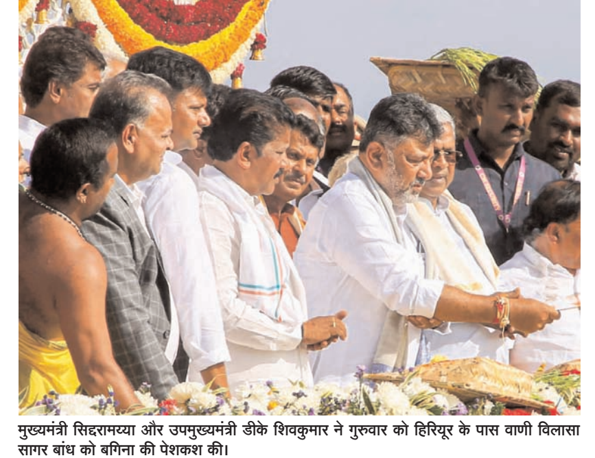
मुख्यमंत्री सिद्धरामय्या और उपमुख्यमंत्री डीके शिवकुमार ने गुरुवार को हिरियूर के पास वाणी विलासा सागर बांध को बगिना की पेशकश की।