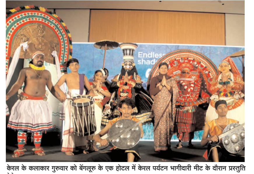
केरल के कलाकार गुरुवार को बंगलूर के एक होटल में केरल पर्यटन भागीदारी मीट के दौरान प्रस्तुति देते हुए।