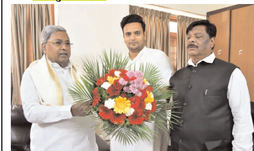
बंगलूरु में सोमवार को मैसूरु के सांसद यदुवीर कृष्णवत चामराजा बांडियार ने मुख्यमंत्री सिद्धरामय्या से कावेरी आवास पर मुलाकात की और मैसूरु क्षेत्र के विकास पर चर्चा की। मैसूरु के प्रभारी मंत्री एचसी महादेवय्या मौजूद रहे।