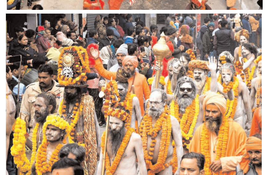
प्रयागराज में सोमवार को तपोनिधि श्री आनंद अखाड़ा पंचायती के साधुओं ने महाकुंभ मेला 2025 के लिए प्रयागराज में संगम की ओर अपने औपचारिक प्रवेश को चिह्नित करते हुए 'छावनी प्रवेश' धार्मिक जुलूस में भाग लिया।