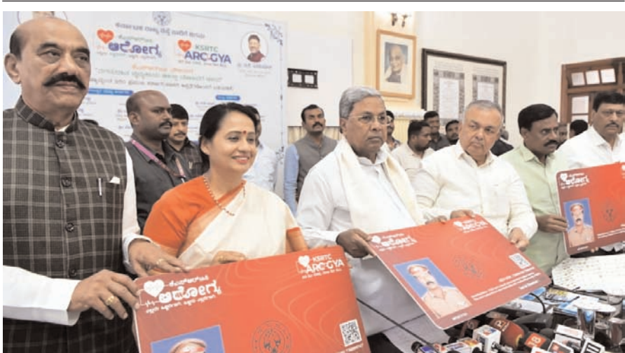
आरोग्य कार्ड को जारी करते हुए मुख्यमंत्री सिद्धरामय्या।