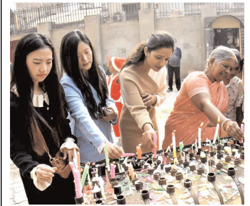
पटना में क्रिसमस समारोह के दौरान कैथोलिक चर्च में भक्त मोमबत्तियाँ जलाते हुए।