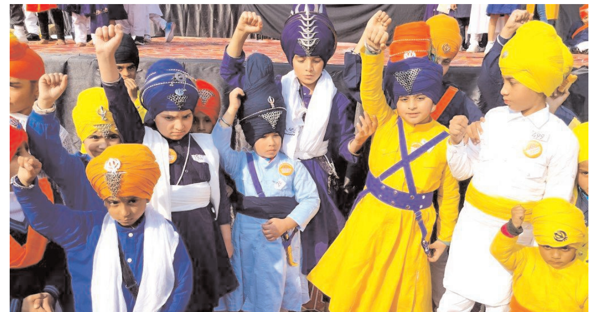
अमृतसर में सिख बच्चों ने सिख गुरु के बेटों की याद में 'चार साहिबजादों' की शहादत को याद करने के लिए पाड़ी बांधने की प्रतियोगिता में भाग लिया।