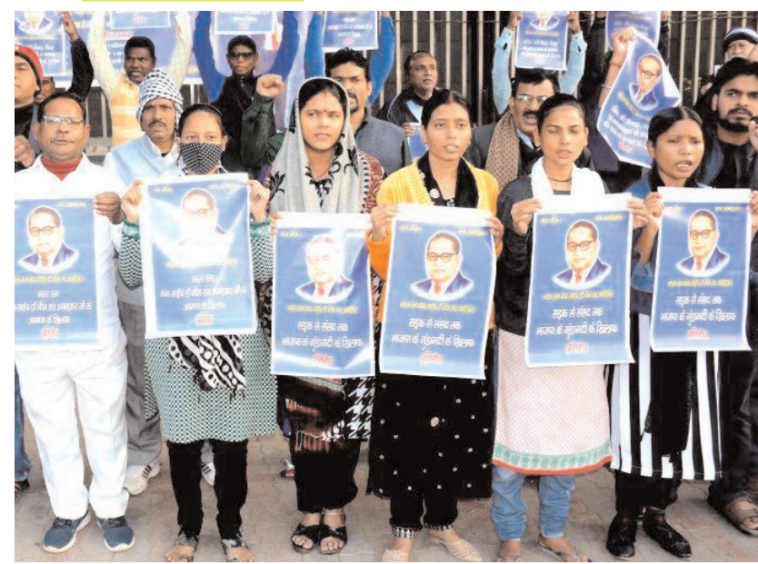
पटना में बाबा साहेब भीम राव अंबेडकर पर केंद्रीय गृह मंत्री अमित शाह के कथित अपमानजनक बयान के खिलाफ विरोध मार्च निकाला।