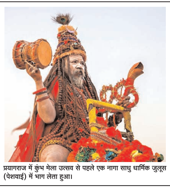
प्रयागराज में कुंभ मेला उत्सव से पहले एक नागा साधु धार्मिक जुलूस (पेशवाई) में भाग लेता हुआ।