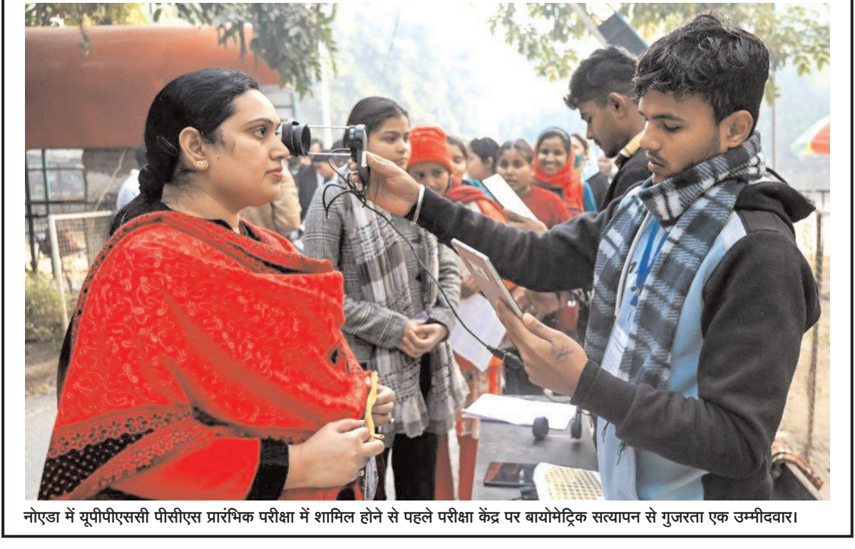
नोएडा में सूपीपीएससी पीसीएस प्रारंभिक परीक्षा में शामिल होने से पहले परीक्षा केंद्र पर बायोमेट्रिक सत्यापन से गुजरता एक उम्मीदवार।