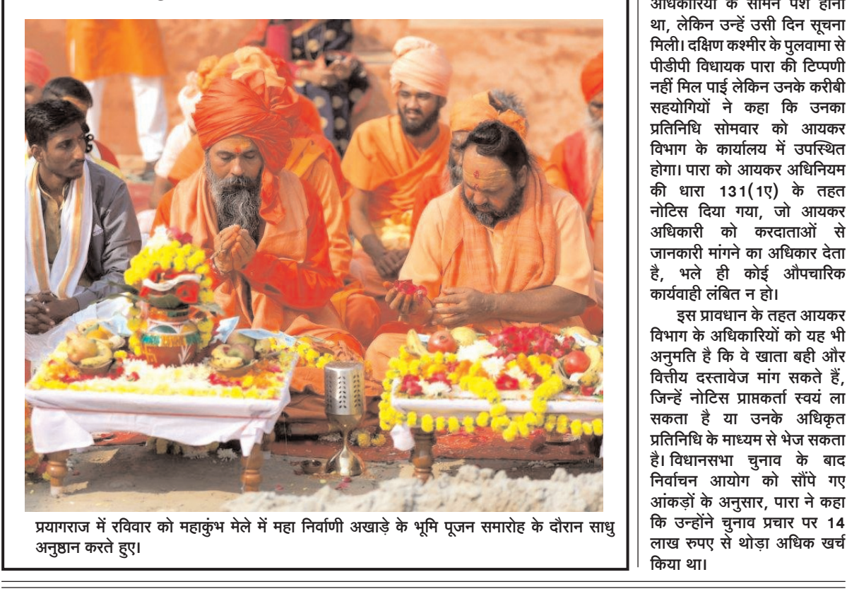
प्रयागराज में रविवार को महाकुंभ मेले में महा निर्वाणी अखाड़े के भूमि पूजन समारोह के दौरान साधु अनुष्ठान करते हुए।