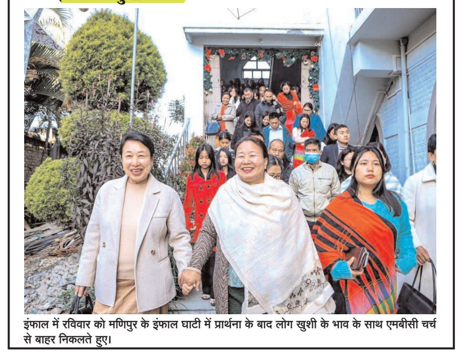
इंफाल में रविवार को मणिपुर के इंफाल घाटी में प्रार्थना के बाद लोग खुशी के भाव के साथ एमबीसी चर्च से बाहर निकलते हुए।