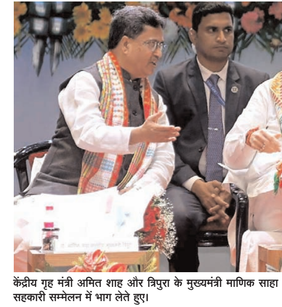
केंद्रीय गृह मंत्री अमित शाह और त्रिपुरा के मुख्यमंत्री माणिक साहा रविवार को त्रिपुरा के अगरतला में सहकारी सम्मेलन में भाग लेते हुए।