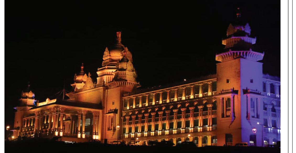
शीतकालीन सत्र : बेलगावी में सोमवार से शुरू होने वाले 10 दिवसीय शीतकालीन सत्र के पहले रविवार रात को रंगबिरंगी रोशनी से सराबोर स्वर्ण सोधा। इन दिनों बेलगावी स्वर्णसोधा शहर के लिए मुख्य आकर्षण का केंद्र बनी हुई है।