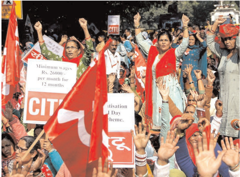
नई दिल्ली में सेंटर ऑफ इंडियन ट्रेड यूनियन के कार्यकर्ताओं ने नई दिल्ली में जंतर-मंतर पर अपनी मांगों को लेकर विरोध प्रदर्शन करते हुए।