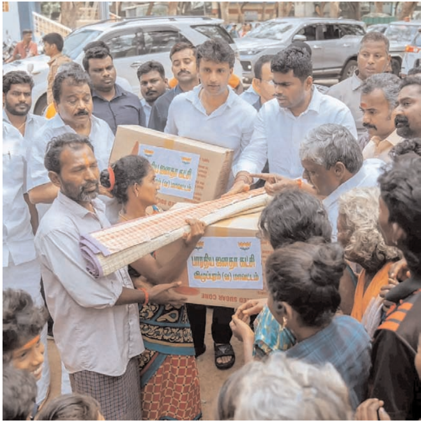
चक्रवात फेंगल के चलते विल्लपुरम के मकानम नगर जो की बुरी तरह से बाढ़ से बुरी तरह प्रभावित हुआ है मंगलवार को तमिलनाडु के भाजपा प्रदेशाध्यक्ष के. अन्नमलाई ने वहाँ प्रभावितों को राहत सामग्री वितरित की।