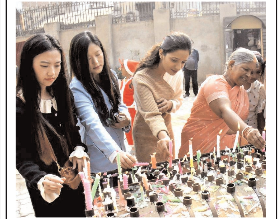
पटना में क्रिसमस समारोह के दौरान कैथोलिक चर्च में भक्त मोमबत्तियाँ जलाते हुए।