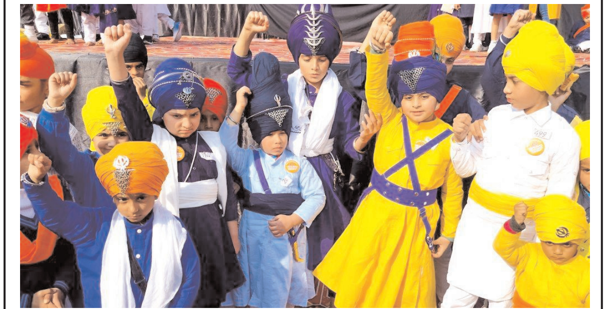
अमृतसर में सिख बच्चों ने सिख गुरु के बेटों की याद में 'चार साहिबजादों' की शहादत को याद करने के लिए पाड़ी बांधने की प्रतियोगिता में भाग लिया।