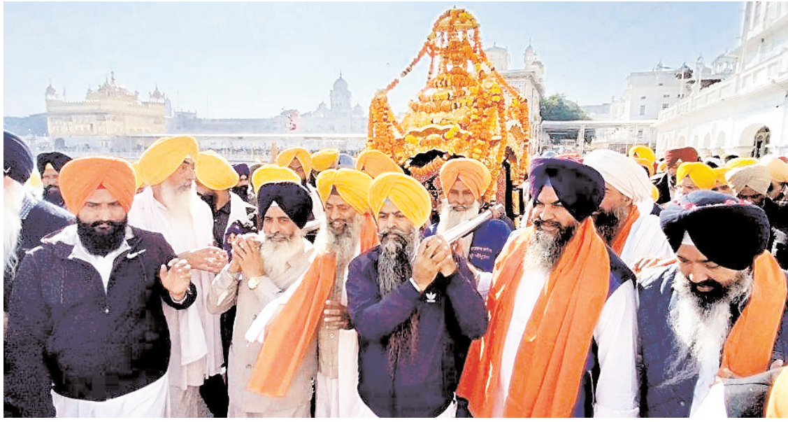
अमृतसर में सिख भक्त गुरुवार को स्वर्ण मंदिर में गुरु तेग बहादुर के शहीदी दिवस की पूर्व संध्या पर नगर कीर्तन जुलूस में भाग लेते हुए।