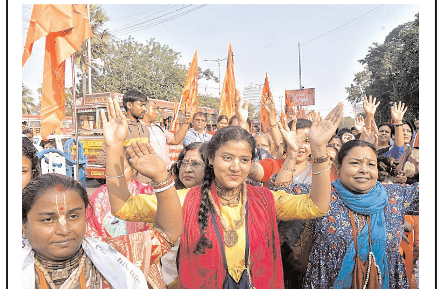
कोलकाता में गुरुवार को हिंदू संत समाज के सदस्य बांग्लादेश में गिरफ्तार हिंदू भिक्षु चिन्मय कृष्ण दास की रिहाई की मांग करते हुए।