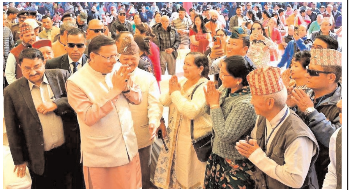
उत्तराखण्ड के मुख्यमंत्री पुष्कर सिंह धामी रविवार को देहरादून में 50वें खलंगा मेले के उद्घाटन के दौरान।