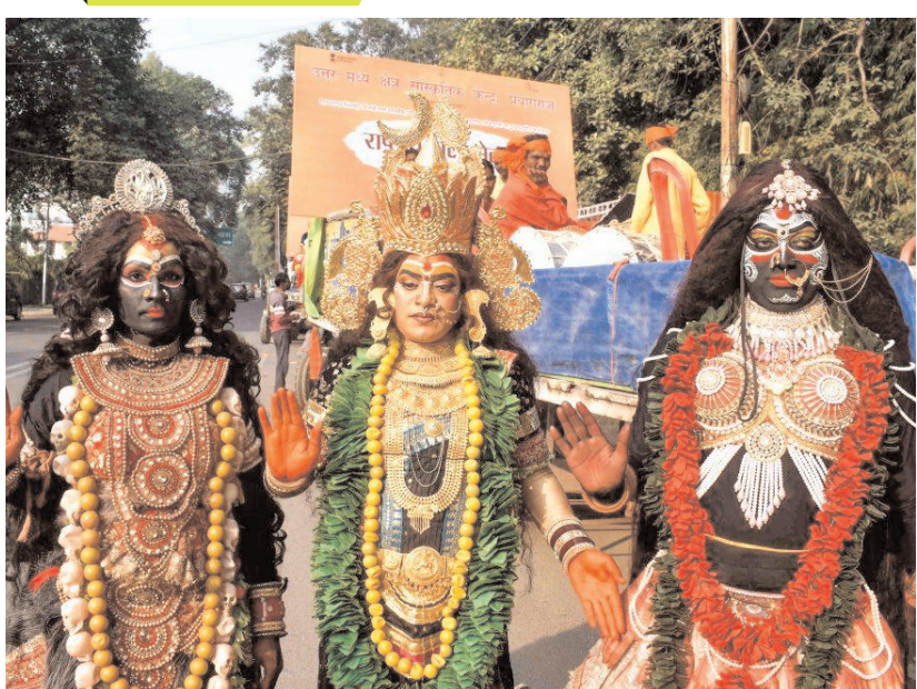
प्रयागराज में रविवार को उत्तर मध्य क्षेत्र सांस्कृतिक केंद्र में शिल्प मेला उत्सव के दौरान देवी काली के वेश में कलाकार।