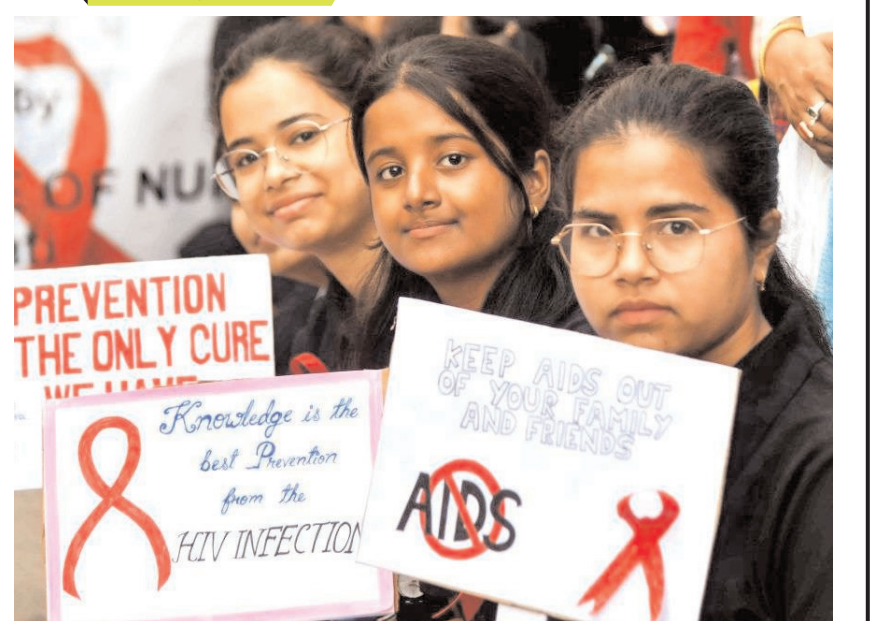
गुवाहाटी में 'विश्व एड्स दिवस' के अवसर पर जागरूकता रैली में क्षेत्रीय नर्सिंग कॉलेज के छात्र भाग लेते हुए।