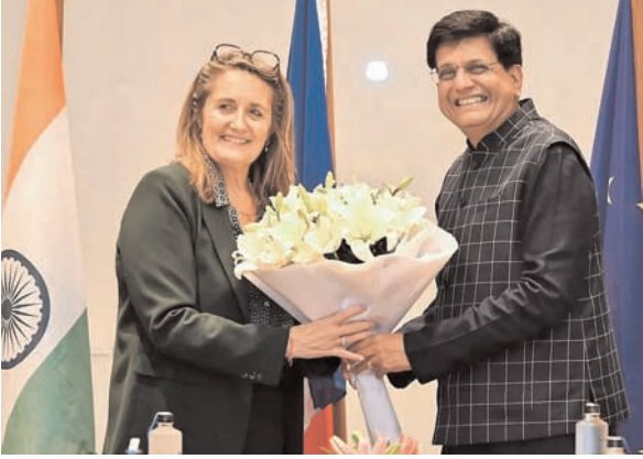
आगे की बातचीत की उम्मीद कर रहा है जो दो-तरफा आर्थिक संबंध का विस्तार कर सकता है। भारत और यूरोपीय संघ ने आठ साल से

दक्षिण भारत राष्ट्रमत dakshinbharat.com नई दिल्ली/भाषा। फ्रांस की विदेश व्यापार मंत्री सोफी प्राइमस ने कहा कि रक्षा क्षेत्र में घनिष्ठ साझेदारी के बाद भारत और फ्रांस अब विशेष रूप से रक्षा उद्योग, नई प्रौद्योगिकियों और विमानन जैसे क्षेत्रों में आर्थिक और व्यापार संबंधों को पर्याप्त रूप से मजबूत करने पर विचार कर रहे हैं।