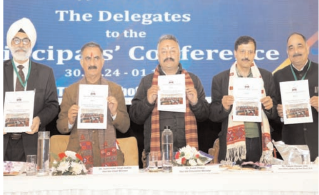
प्रदेश शैक्षणिक संस्थानों के लिए रैंकिंग प्रणाली शुरू करने वाला भारत का पहला राज्य बन गया है। सुक्खू ने कहा कि राज्य सरकार कॉलेज प्राचायों की वित्तीय और प्रशासनिक शक्तियों को बढ़ाने तथा शिक्षा विभाग में विकेंद्रीकरण को बढ़ावा देने की योजना बना रही है। उन्होंने इस बात पर जोर दिया कि गुणवत्तापूर्ण शिक्षा के बिना डिग्री का कोई मूल्य नहीं है। उन्होंने कहा कि राज्य सरकार

दक्षिण भारत राष्ट्रमत dakshinbharat.com शिमला/भाषा। हिमाचल प्रदेश के मुख्यमंत्री सुखविंदर सिंह सुक्खू ने कहा कि राज्य में जिला, उपमंडल और पंचायत स्तर पर उन्नत सुविधाओं से सुसज्जित आधुनिक पुस्तकालय स्थापित किए जाएंगे। पहले चरण में 88 करोड़ रुपये की अनुमानित लागत से 493 पुस्तकालयों की योजना बनाई गई है। रविवार को जारी एक बयान में कहा गया कि शनिवार शाम उच्च शिक्षा विभाग द्वारा आयोजित प्राचायों के सम्मेलन की अध्यक्षता करते हुए उन्होंने उच्च शिक्षा वाले संस्थानों के लिए प्रदर्शन आधारित अनुदान की घोषणा की। सरकारी डिग्री और संस्कृत कॉलेजों में पुस्तकालयों की ग्रेडिंग जारी करते हुए उन्होंने सभी सरकारी क्षेत्रों में प्रणालीगत परिवर्तन के लिए राज्य सरकार की प्रतिबद्धता दोहराई। मुख्यमंत्री ने कहा कि हिमाचल प्रदेश शैक्षणिक संस्थानों के लिए रैंकिंग प्रणाली शुरू करने वाला भारत का पहला राज्य बन गया है। सुक्खू ने कहा कि राज्य सरकार कॉलेज प्राचायों की वित्तीय और प्रशासनिक शक्तियों को बढ़ाने तथा शिक्षा विभाग में विकेंद्रीकरण को बढ़ावा देने की योजना बना रही है। उन्होंने इस बात पर जोर दिया कि गुणवत्तापूर्ण शिक्षा के बिना डिग्री का कोई मूल्य नहीं है। उन्होंने कहा कि राज्य सरकार विक्रिसा शिक्षा के आधुनिकीकरण तथा नवीनतम विक्रिसा प्रौद्योगिकियों को बढ़ावा देने के लिए भी अभिनव कदम उठा रही है तथा इस वर्ष इस क्षेत्र के लिए 500 करोड़ रुपये आवंटित किए गए हैं। शिक्षा मंत्री रोहित ठाकुर ने कहा कि वर्तमान राज्य सरकार के दो वर्ष के कार्यकाल के दौरान लगभग 15,000 शिक्षकों के पद सृजित किए गए हैं तथा इन्हें चरणबद्ध तरीके से भरा जा रहा है।