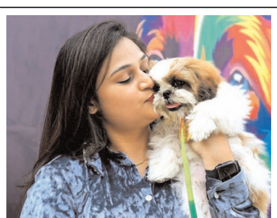
नागपुर में रविवार को नागपुर में ऑरेंज सिटी कैनाइन क्लब द्वारा आयोजित ऑरेंज सिटी डॉग शो के दौरान अपने कुत्ते के साथ एक महिला।