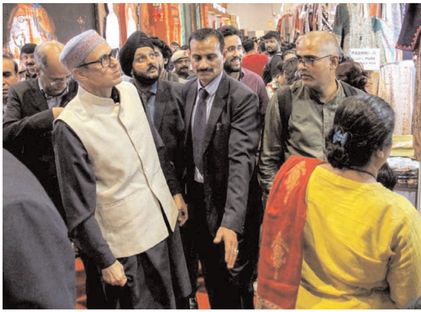
जम्मू और कश्मीर के मुख्यमंत्री उमर अब्दुल्ला शनिवार को नई दिल्ली के भारत मंडप में भारत अंतरराष्ट्रीय व्यापार मेला 2024 के दौरान एक प्रदर्शनी का दौरा करते हुए।