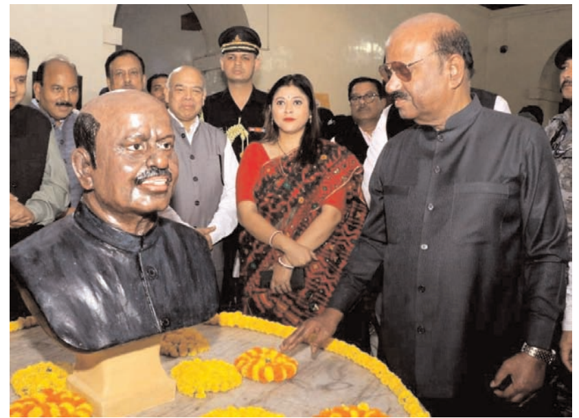
पश्चिम बंगाल के राज्यपाल सी.वी. आनंद बोस ने शनिवार को कोलकाता के राजभवन में अपनी स्वयं की मूर्ति का अनावरण किया।