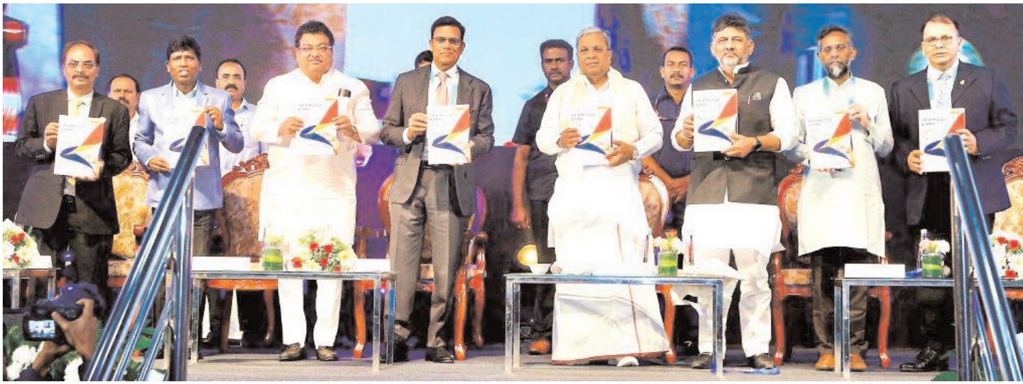
कर्नाटक के मुख्यमंत्री सिद्धरामय्या और जेएसडब्ल्यू स्टील के प्रबंध निदेशक सज्जन जिवदल बुधवार को गांधी कृषि विज्ञान केंद्र में 'आईआईएम एटीएम 2024 और एनएमए' के उद्घाटन पर पहुंचे।