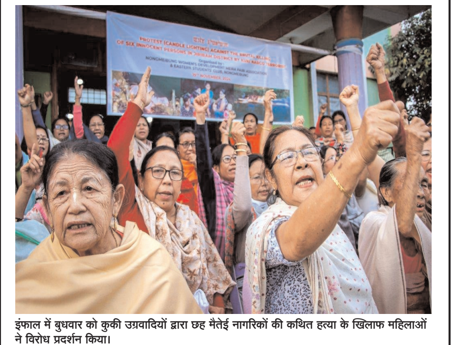
इंफाल में बुधवार को कुकी उग्रवादियों द्वारा छह मैसेई नागरिकों की कथित हत्या के खिलाफ महिलाओं ने विरोध प्रदर्शन किया।