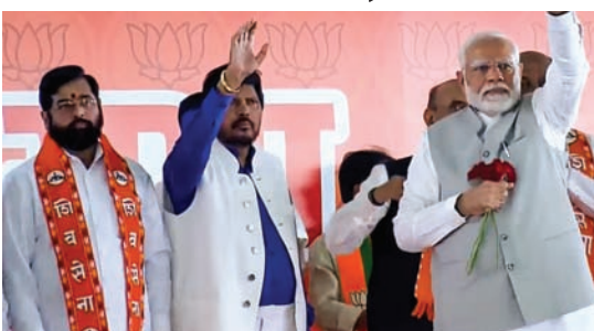
पिछले 10 वर्षों में पहली बार झलात बदले हैं। पहली बार कोई सरकार 25 करोड़ लोगों को गरीबी से बाहर लाई है : प्रधानमंत्री

मुंबई/भाषा। प्रधानमंत्री नरेन्द्र मोदी ने बृहस्पतिवार को कहा कि कांग्रेस ने 'गरीबी हटाओ' का नारा दिया लेकिन उसने गरीबों को ही लूट लिया। उन्होंने आरोप लगाया कि देश की प्रमुख विपक्षी पार्टी की मानसिकता यह सुनिश्चित करने की है कि गरीब प्रगति न करे।