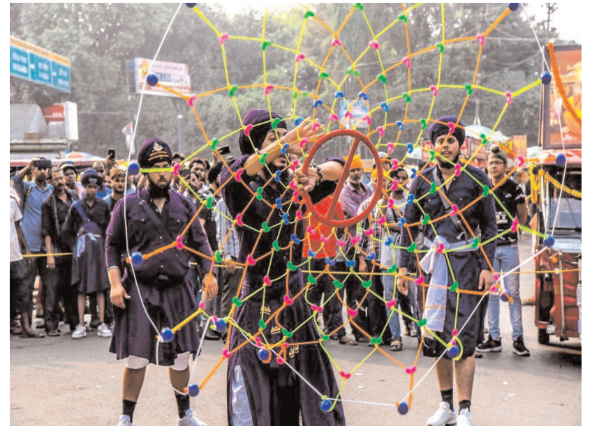
पटना में गुरु गोविंद सिंह की जयंती समारोह से पहले नार कीर्तन जुलूस के दौरान सिख श्रद्धालु अपने कौशल का प्रदर्शन करते हुए।