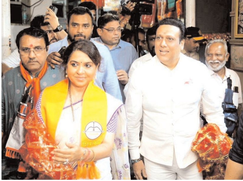
अभिनेता और राजनेता गोविंदा मुंबई में महाराष्ट्र विधानसभा चुनाव से पहले मुंबादेवी विधानसभा क्षेत्र के लिए शिवसेना और महायुति उन्मीदवार शाइना एनसी के समर्थन में प्रचार करते हुए।