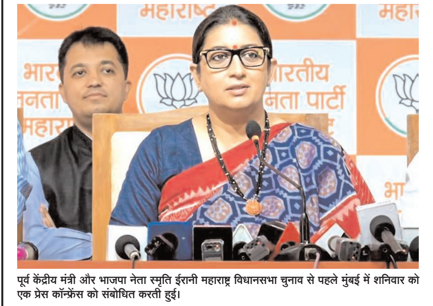
पूर्व केंद्रीय मंत्री और भाजपा नेता स्मृति ईरानी महाराष्ट्र विधानसभा चुनाव से पहले मुंबई में शनिवार को एक प्रेस कॉन्फ्रेंस को संबोधित करती हुई।