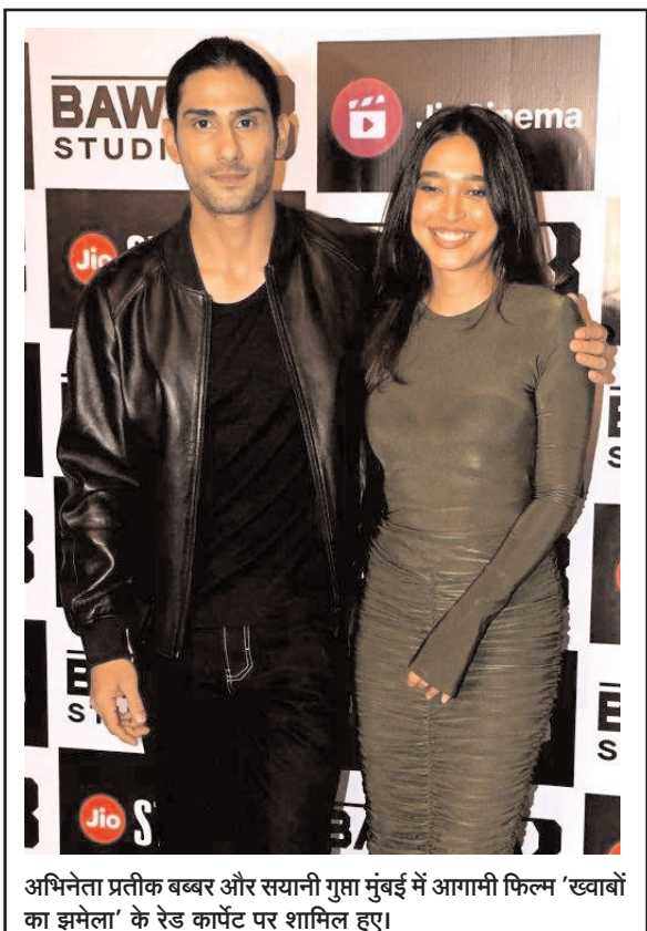
अभिनेता प्रतीक बब्बर और सयानी गुप्ता मुंबई में आगामी फिल्म 'ख्वाबों का झमेला' के रैड कार्पेट पर शामिल हुए।

हमने अभी-अभी गोवा में अपनी शूटिंग पूरी की है और खूबसूरत लोकेशन के साथ यह एक शानदार अनुभव था। मैं लोगों द्वारा इसे देखने का बेसब्री से इंतजार कर रही हूँ। अभिनेत्री को हाल ही में वेब शो हनीमून फोटोग्राफर में देखा गया था, जिसके लिए उन्हें काफी अच्छी समीक्षा मिल रही है।