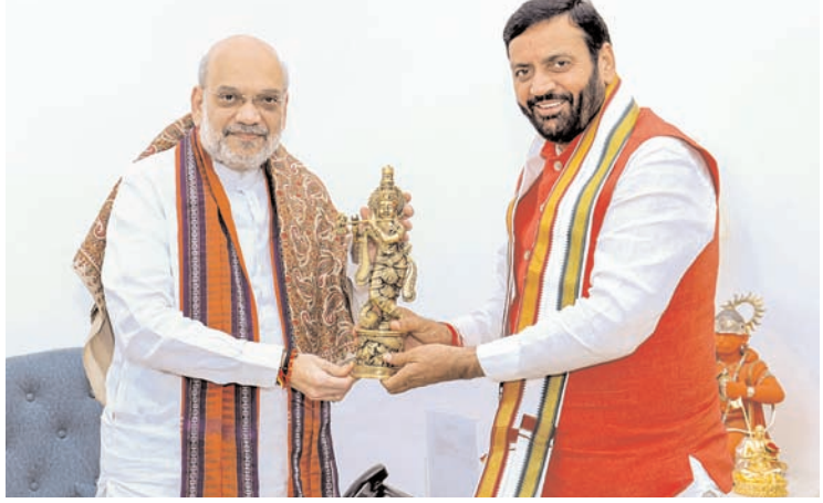
मुझसे मुलाकात की। मैंने उन्हें इस शानदार जीत पर बधाई दी। केंद्रीय गृह मंत्री शाह ने 'एक्स' पर लिखा, "भारतीय जनता पार्टी के लोगों की आशाओं को पूरा करेगी जिन्होंने भारतीय जनता पार्टी को तीसरी बार सेवा करने का मौका दिया है और राज्य में गरीबों के कल्याण और सुशासन के नए कीर्तिमान स्थापित करेगी।"

नई दिल्ली/भाषा। केंद्रीय गृह मंत्री अमित शाह ने बुधवार को कहा कि हरियाणा की नई भारतीय जनता पार्टी (भाजपा) सरकार राज्य के लोगों की आशाओं और आकांक्षाओं को पूरा करेगी और गरीबों के कल्याण तथा सुशासन के नए कीर्तिमान स्थापित करेगी।