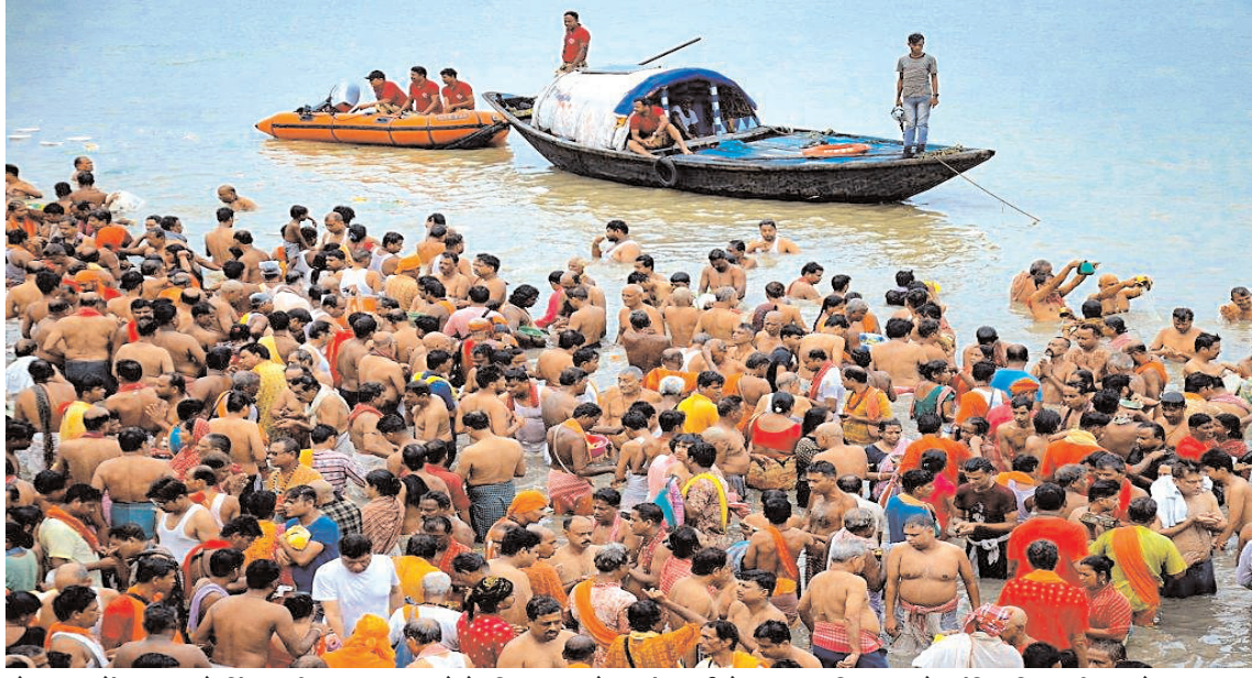
कोलकाता में बुधवार को हिंदू 'तर्पण' अनुष्ठान करने के लिए एकत्र होकर गंगा नदी के तट पर 'पितृ पक्ष' के अंतिम दिन तर्पण करते हुए।