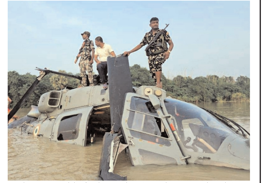
बिहार के मुजफ्फरपुर जिले के औराई में बुधवार को भारतीय वायु सेना (आईएएफ) के एक हेलीकॉप्टर में खराबी आने के बाद उसे जलभराव वाले इलाके में आपातकालीन लैंडिंग करनी पड़ी।