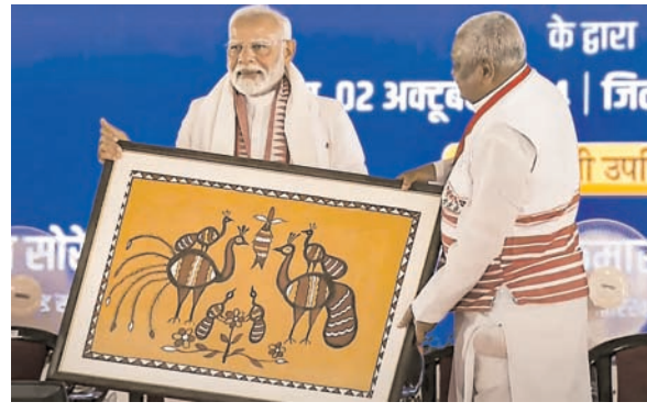
मोदी ने आबकारी कांस्टेबल की भर्ती के दौरान कई अभ्यर्थियों की मौत का हवाला देते हुए गठबंधन के असंवेदनशील रुख की आलोचना की।

मोदी ने भाजपा की परिवर्तन यात्रा के समापन के मौके पर आयोजित एक कार्यक्रम में कहा, 'झारखंड में बेटी, माटी, रोटी की रक्षा करने और भ्रष्टाचार पर अंकुश लगाने के लिए 'परिवर्तन' का समय आ गया है। झारखंड मुक्ति मोर्चा (झामुमो) के नेतृत्व वाला गठबंधन एक खतरनाक खेल खेल रहा है, जो घुसपैठियों को संरक्षण देते हुए लोगों की पहचान, संस्कृति और विरासत को खतरों में डाल रहा है। 'परिवर्तन यात्रा सभी 81 विधानसभा क्षेत्रों से होकर गुजरी और इसने लगभग 5,400 किलोमीटर की दूरी तय की।