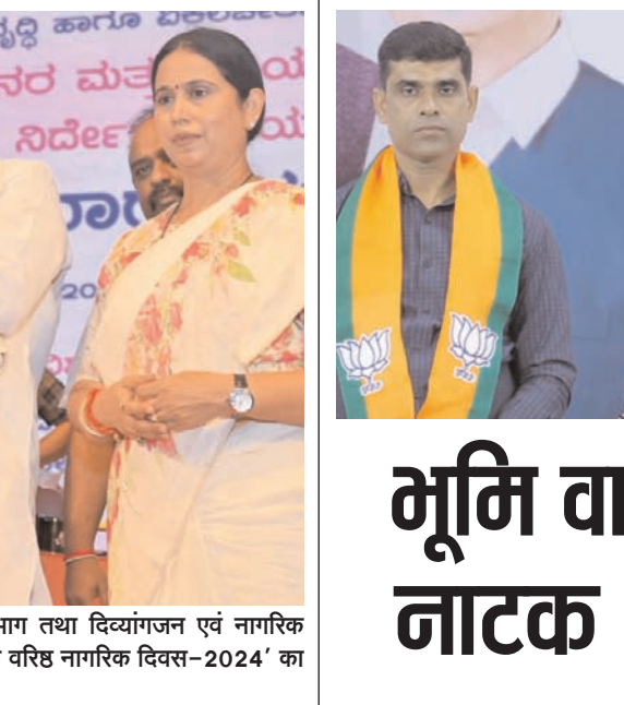
मुख्यमंत्री सिद्धरामय्या ने मंगलवार को प्रवर्तन निदेशालय (ईडी) द्वारा उनके खिलाफ धन शोधन निवारण अधिनियम (पीएनएलए) के तहत मामला दर्ज करने पर सवाल उठाया और कहा कि मैसूरु शहरी विकास प्राधिकरण (एएमयूडीए) मामले में इसके प्रावधान लागू नहीं होते। सिद्धरामय्या ने यहां संवाददाताओं से कहा, मुझे नहीं पता कि यह किस आधार पर धन शोधन का मामला है। संभवतः आपको भी ऐसा ही लगता होगा। मेरे हिसाब से, यह धन शोधन का मामला नहीं बनता क्योंकि ली गई जमीन के बदले में भूखंड दिया गया था, तो