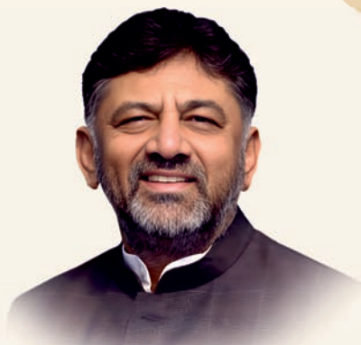
Sri D.K. Shivakumar Hon'ble Deputy Chief Minister