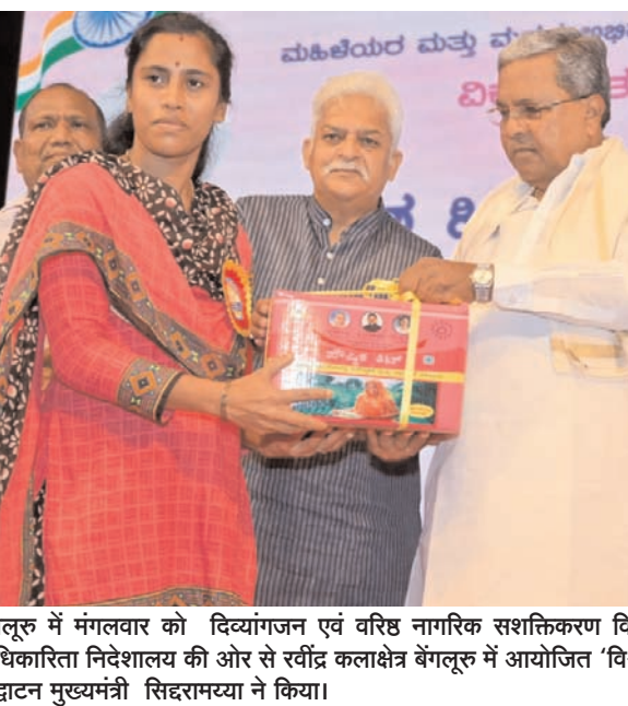
बेंगलूरु में मंगलवार को दिव्यांगजन एवं वरिष्ठ नागरिक सशक्तिकरण विभाग तथा दिव्यांगजन एवं नागरिक अधिकारिता निदेशालय की ओर से रवींद्र कलाक्षेत्र बेंगलूरु में आयोजित 'विश्व वरिष्ठ नागरिक दिवस-2024' का उद्घाटन मुख्यमंत्री सिद्धरामय्या ने किया।