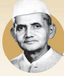
Sri Lal Bahadur Shastri's 120 th birth anniversary