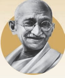
Mahatma Gandhiji's 155 th birth anniversary