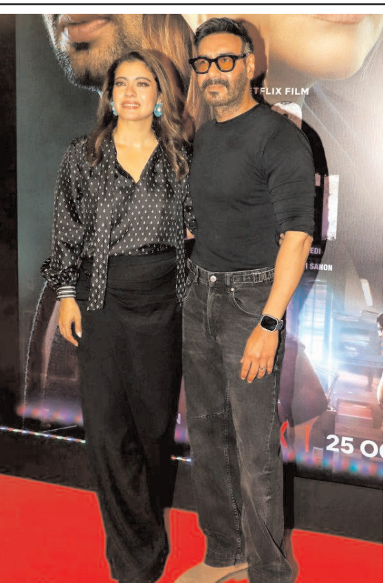
अभिनेत्री काजोल और अजय देवगन मुंबई में आगामी फिल्म 'दो पत्नी' के रेड कार्पेट इवेंट में शामिल हुए।