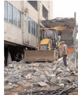
हुई जिसके बाद से ही अग्निशमन एवं आपातकालीन विभाग,