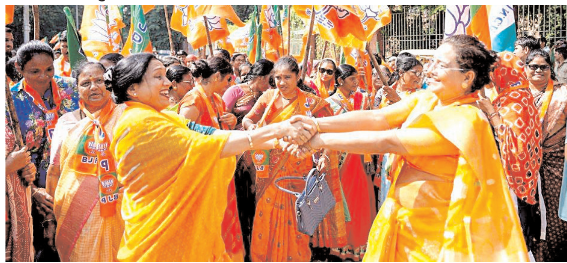
नागपुर दक्षिण पश्चिम निर्वाचन क्षेत्र से भाजपा-महायुति उम्मीदवार देवेन्द्र फडणवीस के नामांकन पर दाखिल करने से पहले उनके समर्थक खुशी मनाते हुए।