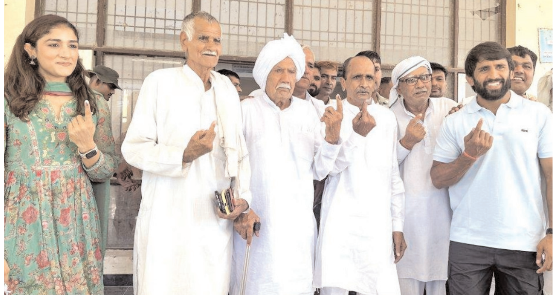
कांग्रेस नेता बजरंग पुनिया, अपनी पत्नी संगीता फोगट और अन्य लोगों के साथ शनिवार को झरूर में हरियाणा विधानसभा चुनाव के दौरान वोट डालने के बाद स्याही लगी उंगली दिखाते हुए।