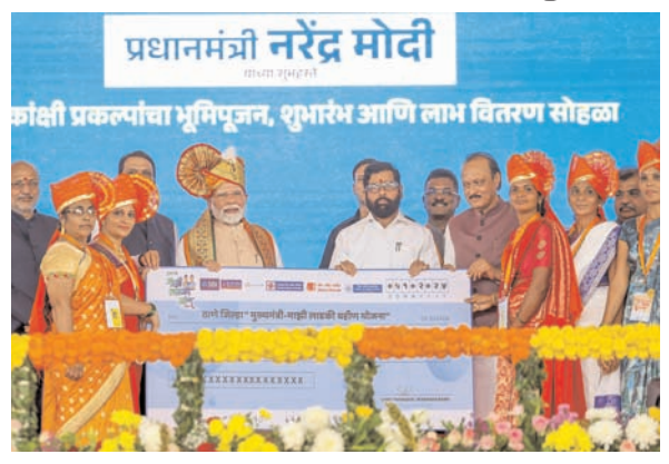
प्रधानमंत्री नरेन्द्र मोदी कोशी प्रकल्पों का भूमिपूजन, शुभारंभ आदि लाभ वितरण सोहळा

दक्षिण भारत राष्ट्रमत dakshinbharat.com वाशिम (महाराष्ट्र)/भाषा। प्रधानमंत्री नरेन्द्र मोदी ने शनिवार को महाराष्ट्र के वाशिम में कृषि और पशुपालन क्षेत्र से जुड़ी करीब 23,300 करोड़ रुपए की परियोजनाओं की शुरुआत की। मोदी महाराष्ट्र के एक-दिवसीय दौरे पर सुबह नांदेड हवाई अड्डा पहुंचे। वहां से यह हेलीकॉप्टर के जरिये वाशिम पहुंचे। वाशिम में मोदी ने पोहरादेवी स्थित जगदम्बा मंदिर में पूजा अर्चना की। उन्होंने पोहरादेवी में ही स्थित संत सेवालाल महाराज और संत रामराय महाराज की समाधि पर जाकर श्रद्धासुमन अर्पित किये। इसके बाद प्रधानमंत्री ने बंजारा विरासत संग्रहालय का उद्घाटन किया, जिसमें बंजारा समुदाय की समृद्ध विरासत को प्रदर्शित किया गया है। अधिकारियों ने बताया कि बाद में आयोजित एक कार्यक्रम के दौरान मोदी ने करीब 9.4 करोड़ किसानों को पीएम-किसान सम्मान निधि के तहत 20,000 करोड़ रुपए की 18वीं किस्त जारी की। उन्होंने बताया कि इस किस्त के साथ ही अबतक इस योजना के तहत किसानों को करीब 3.45 लाख करोड़ रुपए जारी किए जा चुके हैं। प्रधानमंत्री ने 'नमो शेतकारी महासम्मान निधि योजना' की पांचवीं किस्त भी जारी की। इसके तहत राज्य के पात्र किसानों को करीब 2,000 करोड़ रुपए जारी किए गए। उन्होंने कृषि अवरसंरचना कोष (एआईएफ) के तहत 1,920 करोड़ रुपए से अधिक लागत की 7,500 से