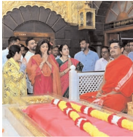
खड़ी नजर आ रही हैं। पूजा-अर्चना के बाद मंदिर ट्रस्ट के सदस्यों ने श्रद्धा का अभिनंदन किया।

बॉलीवुड अभिनेत्री श्रद्धा कपूर शिरडी पहुंचीं, जहां उन्होंने साई बाबा के दर्शन किए। श्रद्धा कपूर, राजकुमार राव और पंकज त्रिपाठी हॉरर कॉमेडी स्त्री 2 सिनेमाघरों में 50 दिन का सफर पूरा कर चुकी हैं। फिल्म की जबरदस्त सफलता के बाद श्रद्धा कपूर हाल ही में शिरडी साई बाबा मंदिर पहुंचीं, जहां उन्होंने पूजा अर्चना की। शिरडी के प्रसिद्ध साई बाबा मंदिर की यात्रा की कुछ तस्वीरें सोशल मीडिया पर वायरल हो रही हैं। इन्होंने तस्वीरों में श्रद्धा बाबा के आगे हाथ जोड़े खड़ी नजर आई। दूसरी तरफ भी साईबाबा संस्थान ट्रस्ट शिरडी के आधिकारिक सोशल मीडिया अकाउंट पर भी श्रद्धा की यात्रा की झलक शेयर की गई है, जिसमें श्रद्धा दिखाई दे रही हैं। ट्रस्ट की ओर से शेयर की गई तस्वीरों में से एक फोटो में श्रद्धा हाथ जोड़कर साई बाबा से प्रार्थना करती नजर आ रही हैं। वहीं एक अन्य फोटो में श्रद्धा मंदिर के अंदर साई बाबा की मूर्ति के सामने हाथ जोड़े