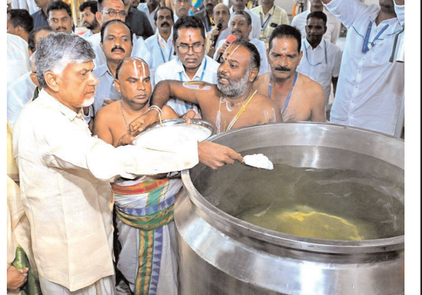
आंध्र प्रदेश के मुख्यमंत्री एन. चंद्रबाबू नायडू शनिवार को तिरुपति के तिरुमाला में केंद्रीकृत वकुलमाथा रसोई का उद्घाटन करते हुए।