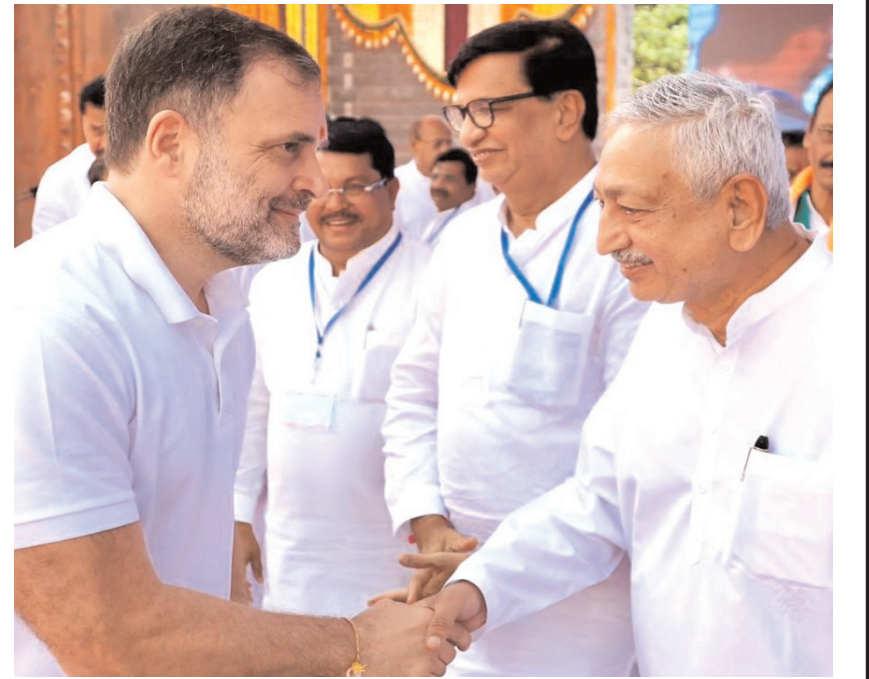
विपक्ष के नेता राहुल गांधी शनिवार को कोल्हापुर के भगवा चौक पर छत्रपति शिवाजी महाराज की प्रतिमा का अनावरण करने के अवसर पर लोगों से बातचीत करते हुए।