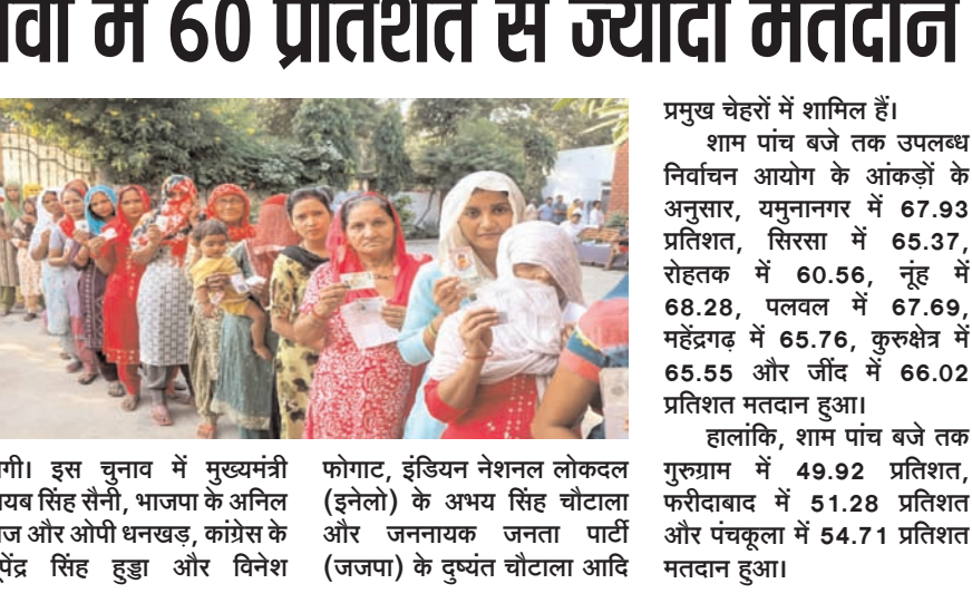
दक्षिण भारत राष्ट्रमत dakshinbharat.com

दक्षिण भारत राष्ट्रमत dakshinbharat.com चंडीगढ़/भाषा। हरियाणा विधानसभा चुनाव में शनिवार को 60 प्रतिशत से अधिक मतदान हुआ। यहां सत्तारूढ़ भारतीय जनता पार्टी (भाजपा) तीसरी बार सत्ता में आने की कोशिश कर रही है, जबकि कांग्रेस एक दशक बाद वापसी की कोशिश में है। अधिकारियों ने बताया कि शाम छह बजे बंद हुआ मतदान सुचारु रूप से संपन्न हुआ, हालांकि नुंह में दो उम्मीदवारों के समर्थकों के बीच झड़प हुई, जिसमें तीन लोग घायल हो गए। शाम पांच बजे तक उपलब्ध आंकड़ों के अनुसार 61 प्रतिशत मतदान दर्ज किया गया है तथा सभी सूचनाएं आने पर इसमें और वृद्धि होगी। भाजपा, कांग्रेस, इनेलो-बसपा और जेजेपी-आजद सज्जा पार्टी गठबंधन और आम आदमी पार्टी चुनाव लड़ने वाली प्रमुख पार्टियां हैं। कुल 1,031 उम्मीदवार मैदान में हैं, जिनमें 101 महिलाएं और 464 निर्दलीय उम्मीदवार शामिल हैं। मतगणना आठ अक्टूबर को