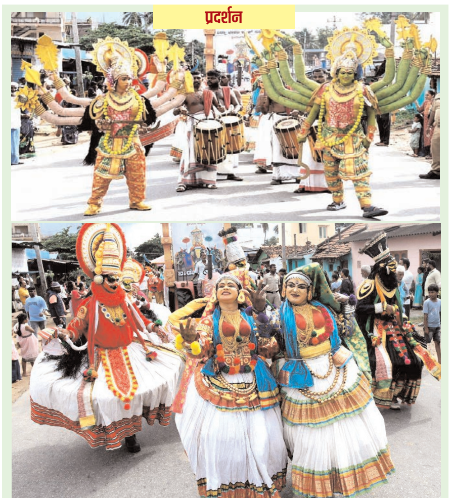
श्रीरंगपटना में शुक्रवार को दशहरा जुलूस के उद्घाटन के दौरान कलाकार प्रदर्शन करते हुए।