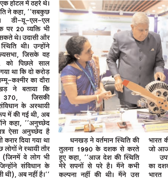
धनखड़ ने वर्तमान स्थिति की तुलना 1990 के दशक से करते हुए कहा, "आज देश की स्थिति मेरे सपनों से परे है। मैंने कभी कल्पना नहीं की थी। मैंने उस

दक्षिण भारत राष्ट्रमत dakshinbharat.com नई दिल्ली/भाषा। जम्मू-कश्मीर विधानसभा चुनाव के बीच उपराष्ट्रपति जगदीप धनखड़ ने बृहस्पतिवार को कहा कि जब वह 1990 में वहां गए थे तो श्रीनगर की डल झील 'डल' (नीरस) थी, लेकिन अब यह पर्यटकों से गुलजार है। उन्होंने इस बात की ओर भी ध्यान दिलाया कि अब इस क्षेत्र में अनुच्छेद 370 लागू नहीं है। वैज्ञानिक और औद्योगिक अनुसंधान परिषद (सीएसआईआर) के 83वें स्थापना दिवस समारोह को संबोधित करते हुए धनखड़ ने केंद्रीय मंत्री के रूप में 1990 में श्रीनगर की अपनी यात्रा को याद किया, जब वह डल