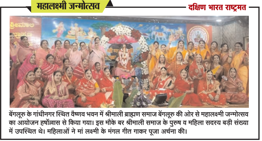
बेंगलूरु के गांधीनगर स्थित वैष्णव भवन में श्रीमाली ब्राह्मण समाज बेंगलूरु की ओर से महालक्ष्मी जन्मोत्सव का आयोजन हर्षोल्लास से किया गया। इस मौके बर श्रीमाली समाज के पुरुष व महिला सदस्य बड़ी संख्या में उपस्थित थे। महिलाओं ने मां लक्ष्मी के मंगल गीत गाकर पूजा अर्चना की।