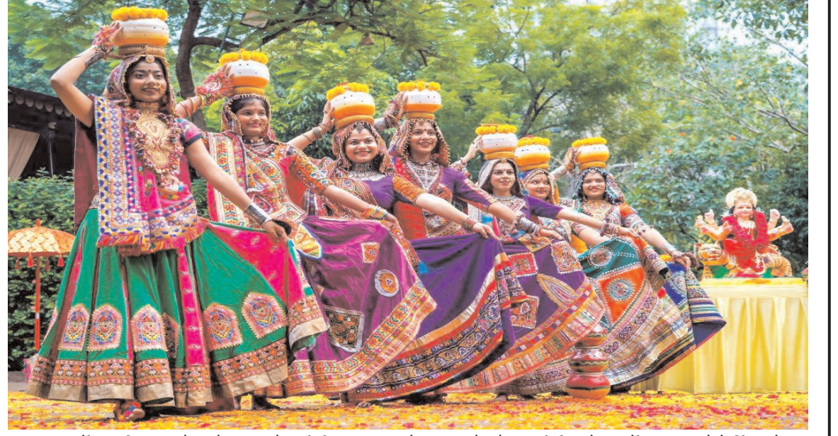
अहमदाबाद में नवरात्रि उत्सव से पहले गुजरात के पारंपरिक नृत्य गरबा के अभ्यास के दौरान पारंपरिक पोशाक में कलाकार फोटो खिंचवाते हुए।