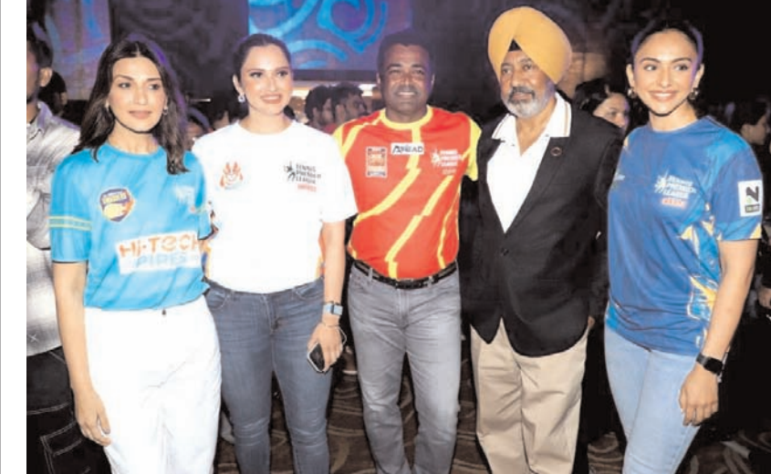
मुंबई में बुधवार को टेनिस प्रीमियर लीग सीजन की नीलामी में रकुल प्रीत सिंह, सोमाली बेंदे और सानिया मिर्जा।