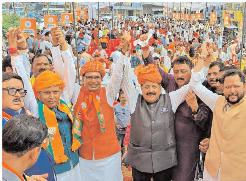
केंद्रीय मंत्री और भाजपा नेता शिवराज सिंह चौहान बुधवार को कडुआ में जम्मू-कश्मीर विधानसभा चुनाव के लिए कडुआ विधानसभा क्षेत्र से भाजपा उम्मीदवार भारत भूषण के समर्थन में एक जनसभा के दौरान।