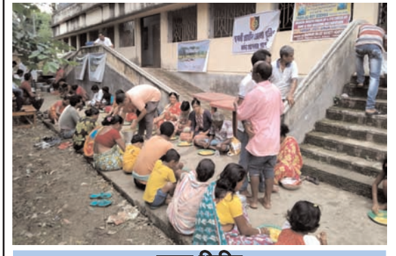
कोलकाता में सोमवार को गंगा मिशन और चिंशुरा आरोग्य की ओर से हंगली जिले के बाढ़ ग्रस्त इलाके आरामबाग उपमंडल के खानाकुल की राधानगर ग्रामपंचायत में राहत शिविर का आयोजन किया गया।