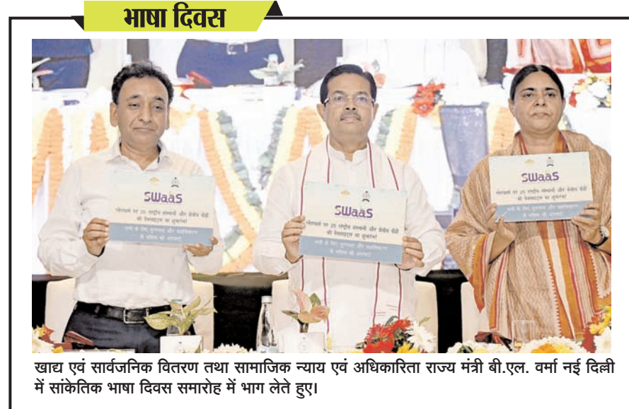
खाद्य एवं सार्वजनिक वितरण तथा सामाजिक न्याय एवं अधिकारिता राज्य मंत्री बी.एल. वर्मा नई दिल्ली में सांकेतिक भाषा दिवस समारोह में भाग लेते हुए।