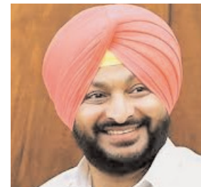
हालांकि मंत्री ने इस सवाल पर कुछ नहीं कहा कि वह राहुल गांधी के

उन्होंने कहा, राहुल गांधी तो खुद किन्ती बार गुरुद्वारा दरबार साहिब जाते हैं... कौन रोक्ता है? इसलिए यह पार्टी की बात नहीं है, पार्टी से ऊपर की बात है। बिट्टू ने कहा, आप कोई भी एक आदमी बताओ... किसने हमें कड़ा पहनने से रोका है? किसने हमें पगड़ी बांधने से रोका है? किसने हमें गुरुद्वारे जाने से रोका है? इसलिए अगर कांग्रेस को विरोध करना है तो राहुल गांधी का करना चाहिए।