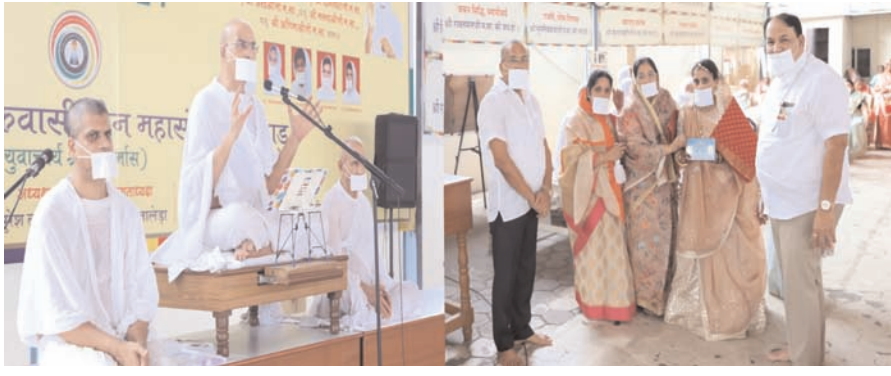
है साधना का स्वरूप।