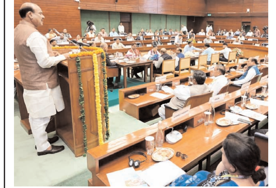
नई दिल्ली में सोमवार को लोकसभा अध्यक्ष ओम बिरला ने आज नई दिल्ली में संसद भवन परिसर में 10वें राष्ट्रमंडल संसदीय संघ (सीपीए) भारत क्षेत्र सम्मेलन के पूर्ण सत्र की अध्यक्षता करते हुए विधानमंडलों की कार्यकुशलता और कार्यप्रणाली में सुधार के लिए प्रौद्योगिकी के उपयोग पर बल दिया।