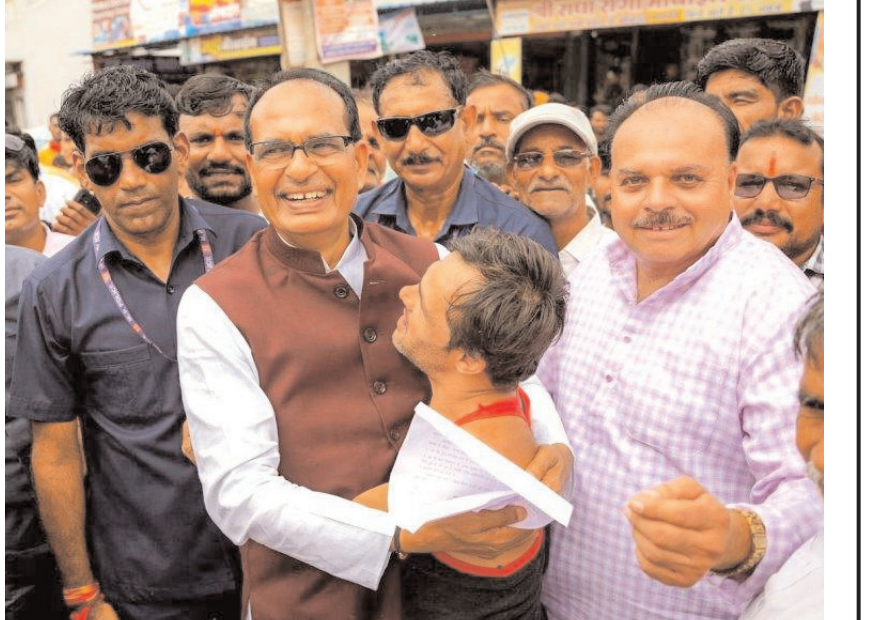
केंद्रीय मंत्री शिवराज सिंह चौहान रविवार को देवास के काठेगांव की यात्रा के दौरान इच्छावर में स्थानीय लोगों द्वारा गर्मजोशी से स्वागत किए किया गया।