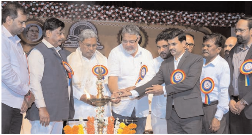
मैसूरु में रविवार को मुख्यमंत्री सिद्धरामय्या ने मैसूरु पिछड़ा वर्ग छात्रावास के वरिष्ठ छात्र संघ का उद्घाटन किया।

सिद्धरामय्या ने डॉ. बीआर अंबेडकर के दृष्टिकोण पर जोर दिया, जिन्होंने पिछड़े वर्गों, दलितों और अल्पसंख्यकों के लिए समान अवसरों की वकालत की। उन्होंने बताया कि आज व्याप्त असमानता ऐसे अवसरों की कमी से उत्पन्न है। सिद्धरामय्या ने कहा, अंबेडकर ने संविधान के तहत सभी को समान अधिकार मिले, यह सुनिश्चित करने के लिए अथक प्रयास किया। युवा पीढ़ी में सामाजिक जिम्मेदारी को बढ़ावा देने के लिए संविधान की प्रस्तावना के बारे में