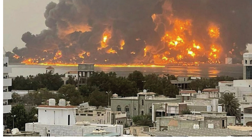
हृतियों के द्वारा किए गए बैलिस्टिक मिसाइल हमले के जवाब में