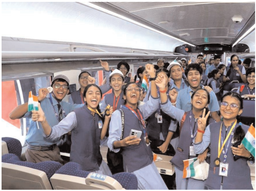
मेरठ में शनिवार को स्कूली छात्र मेरठ में मेरठ सिटी-लखनऊ बंद भारत एक्सप्रेस की उड़ान यात्रा का आनंद लेते हुए।