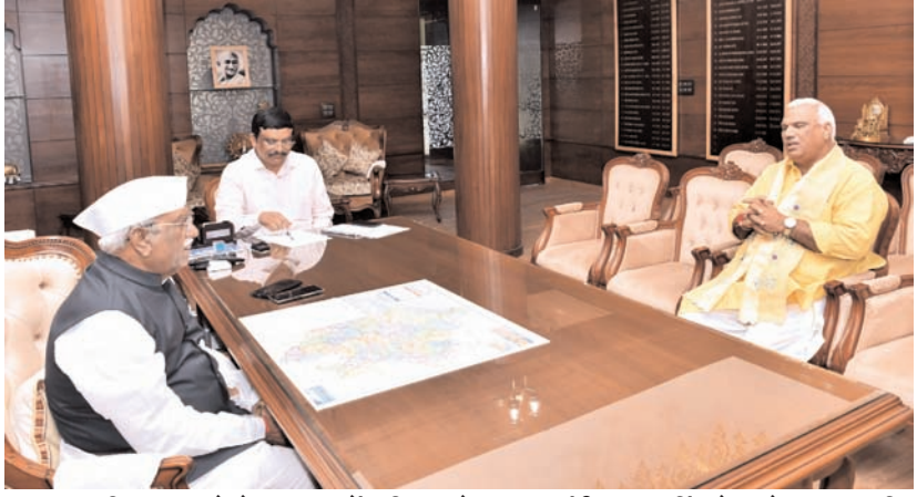
राज्यपाल हरिभाऊ बागडे से राजभवन में शनिवार को गृह राज्यमंत्री जवाहर सिंह बेदम ने मुलाकात की। उन्होंने इस दौरान राज्यपाल को राम मंदिर और भवनान श्री राम का छाया चित्र भी भेंट किया। राज्यपाल बागडे से उनकी यह शिष्टाचार भेंट थी।