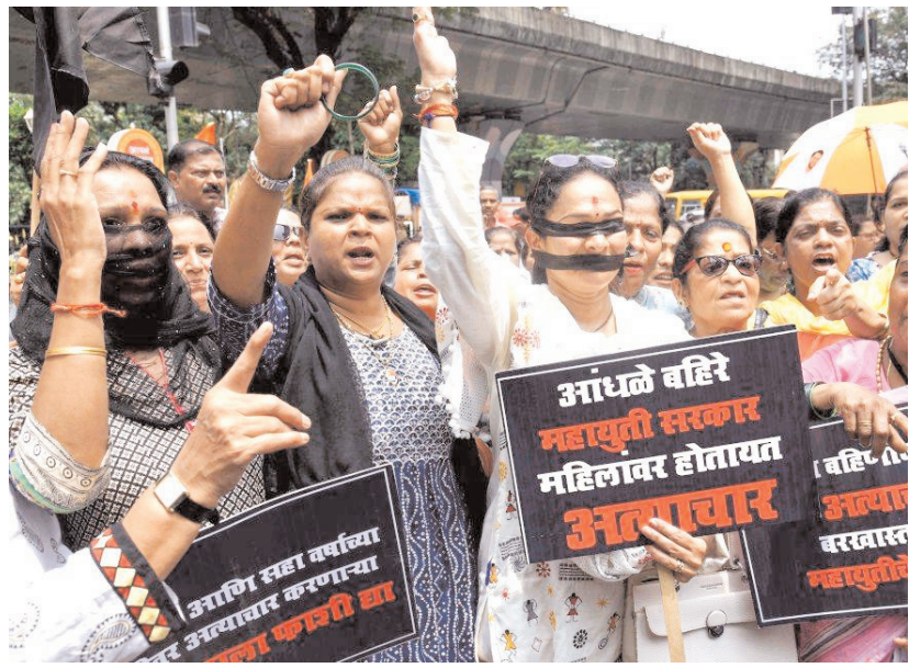
मुंबई में बुधवार को शिवसेना की महिला कार्यकर्ता (यूबीटी) ने बदलापुर में एक स्कूल में सफाई कर्मचारी द्वारा दो चार वर्षीय लड़कियों के कथित यौन उत्पीड़न के खिलाफ विरोध प्रदर्शन किया।