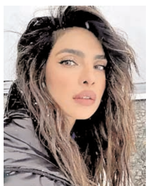
अक्टूबर 2024 को सिनेमाघरों में रिलीज होगी। प्रियंका चोपड़ा ने

प्रियंका चोपड़ा ने अपने ऑफिशियल इंस्टाग्राम हैंडल पर पाणी का मोशन टीजर रिलीज करते हुए इसकी रिलीज डेट रिवील की है, जिसके मुताबिक पाणी 18