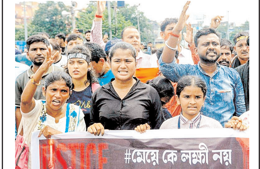
कोलकाता में मंगलवार को छात्र संगठन 'पश्चिम बंगा छात्र समाज' और असंतुष्ट राज्य सरकार के कर्मचारियों ने 'पश्चिम बंगा छात्र समाज' द्वारा आयोजित 'नवम्ब्रा मार्च' के दौरान आरजी कॉलेज में प्रशिक्षु डॉक्टर के बलात्कार और हत्या को लेकर चल रहे विवादा के बीच सीएम ममता बनर्जी के इस्तीफे की मांग की।