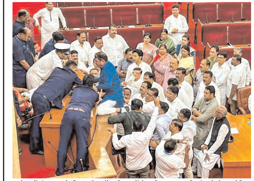
भुवनेश्वर में मंगलवार को बीजद और कांग्रेस विधायकों ने जाति जनगणना की मांग को लेकर ओडिशा विधानसभा में अध्यक्ष सुरमा पांडे के सामने विरोध प्रदर्शन किया।