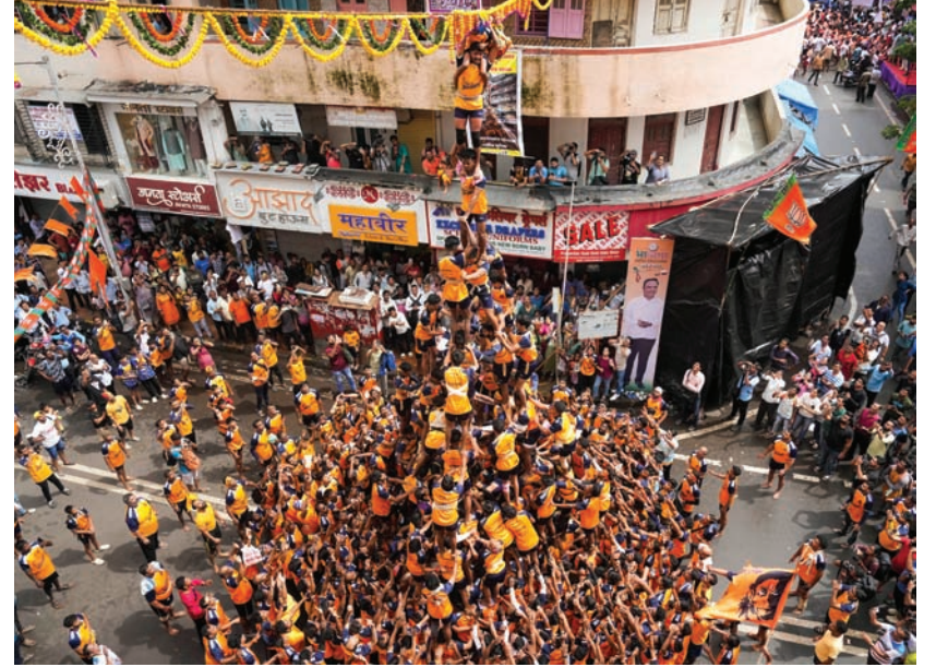
मंगलवार को मुंबई के दादर में जन्माष्टमी उत्सव के अवसर पर भक्तजन दही से भरे मिट्टी के बर्तन 'दही हांडी' को तोड़ने के लिए मानव पिरामिड बनाते हुए।