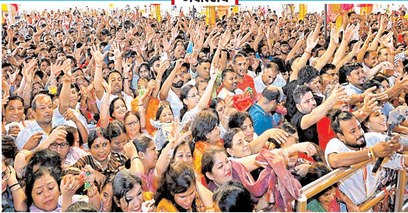
जयपुर में मंगलवार को भक्तगण गोविंद देव जी मंदिर में 'नंदोत्सव' के दौरान एक समारोह के हिस्से के रूप में भगवान कृष्ण से संबंधित वस्तुओं को इकट्ठा करते हुए