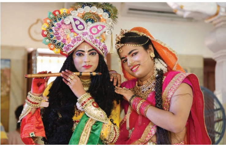
सोमवार को जन्माष्टमी के अवसर पर नई दिल्ली में लक्ष्मी नारायण मंदिर (बिड़ला मंदिर) में भगवान राधा-कृष्ण की वेशभूषा में प्रदर्शन करते कलाकार।