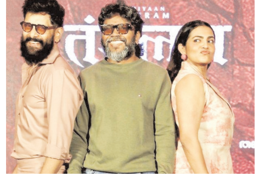
मुंबई में सोमवार को अपनी फिल्म 'थंगालान' के लिए प्रेस कॉन्फ्रेंस के दौरान अभिनेता विक्रम, मालविका मोहनन।