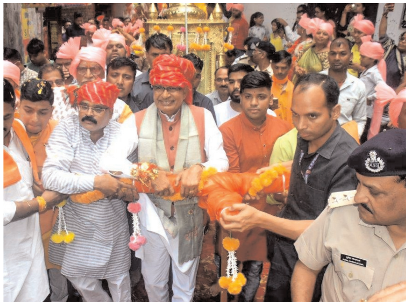
भोपाल में सोमवार को केंद्रीय कृषि और किसान कल्याण मंत्री शिवराज सिंह चौहान बुरखेड़ी में कृष्ण जन्माष्टमी उत्सव के अवसर पर एक मंदिर में समारोह में भाग लेते हुए