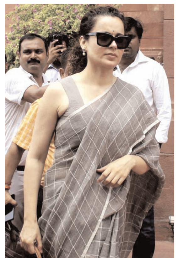
नई दिल्ली में बुधवार को 18वीं लोकसभा के दूसरे सत्र के दौरान संसद भवन में जाती भाजपा सांसद कंगना रानौता।