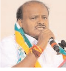
कुमारस्वामी ने पैदल मार्च के संबंध में जद(एस) की ओर से भाजपा को नैतिक समर्थन देने से भी इनकार किया।

बंगलूर। कर्नाटक के मुख्यमंत्री सिद्धरामय्या की पत्नी समेत विभिन्न लोगों को मसूर शहरी विकास प्राधिकरण (एमयूडीए) की ओर से भूमि के आवंटन में हुई कथित अनियमितताओं के खिलाफ विपक्ष के प्रस्तावित पैदल मार्च से जनता दल (एस) पीछे हट गया है और पार्टी नेता एच डी कुमारस्वामी ने भाजपा पर निशाना साधा है। जद(एस) के नेता और पूर्व मुख्यमंत्री एच डी कुमारस्वामी ने आरोप लगाया कि पैदल मार्च के बारे में उनकी पार्टी को भरोसे में नहीं लिया गया। उन्होंने इस मार्च का नेतृत्व करने वालों में हासन जिले के एक नेता को शामिल करने के लिए भारतीय जनता पार्टी (भाजपा) पर निशाना साधा।