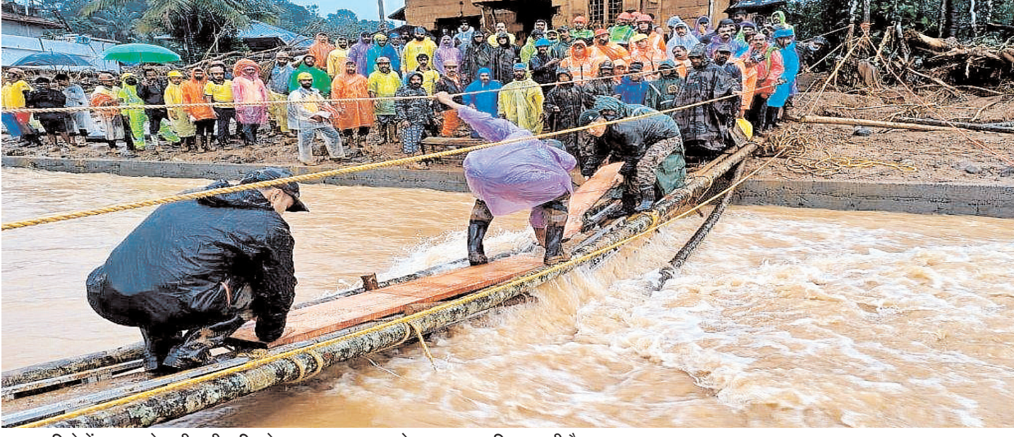
वायनाड जिले में बुधवार को जारी भारी बारिश के कारण हुए भूस्खलन के बाद बचाव अभियान जारी है।