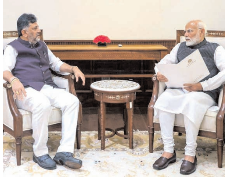
नई दिल्ली में बुधवार को कर्नाटक के उपमुख्यमंत्री डीके शिवकुमार ने प्रधानमंत्री नरेंद्र मोदी से मुलाकात की।

शिवकुमार ने कहा कि उन्होंने ऊपरी भद्रा परियोजना के लिए पिछले बजट में 5,300 करोड़ रुपये देने के बावजूद केंद्र द्वारा कोई धन जारी नहीं करने का पट्टा उठाया। उन्होंने कहा कि प्रधानमंत्री मोदी ने मंत्रिमंडल की आगामी बैठक में इस मुद्दे को उठाने का वादा किया है।