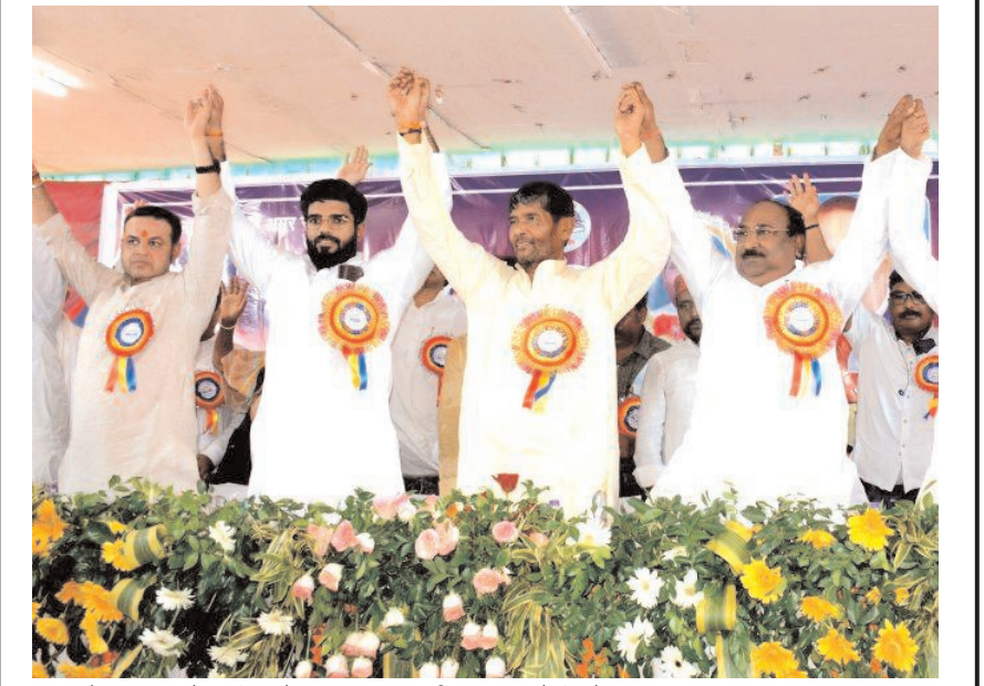
पटना में बुधवार को राष्ट्रीय लोक जनशक्ति पार्टी (आरएलजेपी) के अध्यक्ष पशुपति कुमार पारस राज्य विधानसभा चुनाव से पहले पार्टी की बैठक के दौरान बिहार पार्टी अध्यक्ष प्रिस राज और अन्य के साथ।