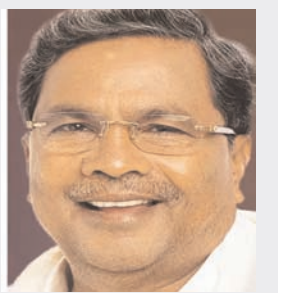
मुख्यमंत्री ने उद्योग जगत को लिखे पत्र में कहा, आपदा की व्यापकता और भयावहता को देखते हुये समाज के सभी क्षेत्रों, खास कर उद्योग जगत को उदार रुख अपनाने की आवश्यकता है। उद्योग जगत जरूरत के समय हमेशा आगे रहा है। उन्होंने कहा कि कर्नाटक विशेष रूप से राहत कार्यों एवं पुनर्निर्माण प्रयासों तथा खाद्य आपूर्ति, विशेष रूप से शीघ्र खराब न होने वाली खाद्य वस्तुओं एवं कपड़ों की आपूर्ति के लिए आर्थिक सहायता की तलाश में बढ़ोतरी हो सकती है।

बंगलूर। कर्नाटक के मुख्यमंत्री सिद्धरामय्या ने बुधवार को कॉरपोरेट जगत से पड़ोसी राज्य केरल के वायनाड जिले में भूखलन से बड़ी संख्या में प्रभावित लोगों के राहत एवं पुनर्वास के लिए उदारतापूर्वक योगदान देने की अपील की। उद्योग जगत को भेजे संदेश में सिद्धरामय्या ने उनसे कॉरपोरेट सामाजिक उत्तरदायित्व (सीएसआर) पहल के माध्यम से प्रभावित क्षेत्रों के पुनर्निर्माण में मदद करने का आह्वान किया।