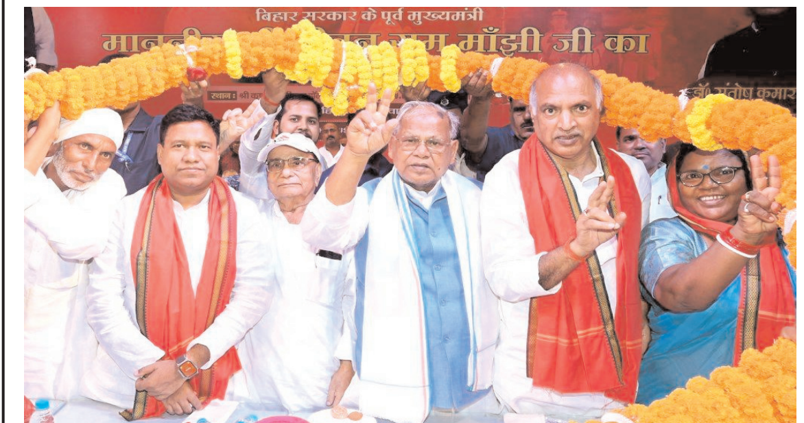
पटना में शनिवार को उसके मेमोरियल हॉल में एक अभिनंदन समारोह के दौरान पार्टी नेताओं और कार्यकर्ताओं द्वारा केंद्रीय मंत्री जीतन राम मांझी को माला पहनाई गई।