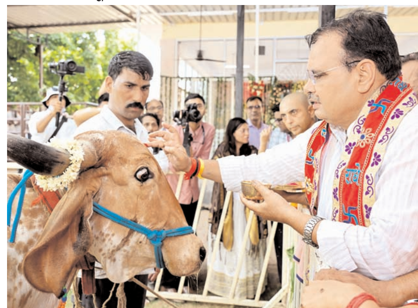
हिंगोलिया गौशाला में शनिवार को मुख्यमंत्री भजनलाल शर्मा गो माता के विधिवत पूजन व गौशाला प्रांगण में स्थित मंदिर में महादेव व देवकीनंदन प्रभु श्री कृष्ण के पावन दर्शन पूजन कर समस्त प्रदेशवासियों के सुख, समृद्धि एवं सुखशीली हेतु कामना की।