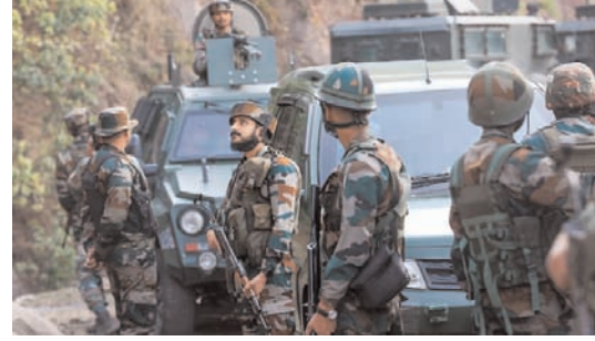
घायल हुए। इस हमले की जम्मू और अन्य क्षेत्रों में व्यापक निंदा की गई।

जम्मू/भाषा। जम्मू कश्मीर के डोडा जिले में, पाकिस्तानी आतंकी संघटन जैश-ए-मोहम्मद के हथियारों से लैस आतंकवादियों के साथ भीषण मुठभेड़ में एक कैप्टन समेत सेना के चार जवान शहीद हो गए। जम्मू क्षेत्र में तीन हफ्तों में यह तीसरी बड़ी आतंकी घटना है।