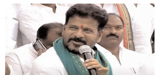
कहा कि मानसिक रूप से मजबूत बच्चों को तैयार करने के लिए उन्हें सामाजिक पुलिसिंग और सामुदायिक पुलिसिंग सिखाने की आवश्यकता है। उन्होंने कहा कि विषयों को पढ़ाने के अलावा, स्कूल और कॉलेज के छात्रों को नैतिक पुलिसिंग में शामिल होने की आदत डालनी चाहिए। उन्होंने सुझाव दिया कि प्रबंधन बच्चों में व्यवहार परिवर्तन की निगरानी के लिए एक प्रणाली विकसित करें। उन्होंने कहा कि

हैदराबाद। तेलंगाना के मुख्यमंत्री ए रेंवत रेड्डी ने कहा कि प्रौद्योगिकी समाज में बढ़ती बुरी प्रवृत्तियों का कारण बन गई है और कहा कि बच्चों को मोबाइल फोन से दूर रखकर हम कई समस्याओं को रोक सकते हैं। शनिवार शाम यहां जेएनटीयू में छात्र स्पोर्ट्स क्लब पुलिसिंग कार्यक्रम को संबोधित करते हुए रेड्डी ने कहा कि अगर हम समाज में समस्याओं की पहचान करें और उनका समाधान करें तो अवांछनीय परिणामों को रोका जा सकता है। उन्होंने कहा कि बच्चों की मनोवैज्ञानिक कमजोरी का कारण यह है कि परिवार व्यवस्था तेजी से बिखर रही है जबकि संयुक्त परिवार बच्चों को मानसिक रूप से मजबूत होने में मदद करता है। मुख्यमंत्री ने