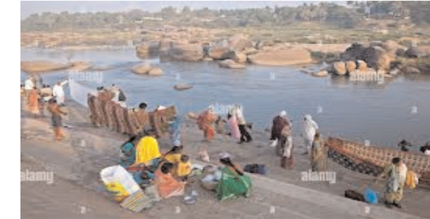
तुंगभद्रा नदी तट पर पानी का बहाव रोज तेजी से बढ़ रहा है। पर्यटक अपनी जान को जोखिम में डालकर नदी के तट पर गहरे पानी में उतर रहे हैं। वो तस्वीर और रीत बनाने में इतने मशगूल हो गए हैं कि उन्हें यह समझ नहीं आ रहा है कि यह उनके लिए घातक साबित हो सकता है। नदी का तेज बहाव किसी भी समय तट के किनारे पर्यटकों तक पहुंच सकता है, लेकिन उन्हें इस बात की कोई परवाह नहीं है। मौज-मस्ती के

बंगलूरु। कर्नाटक के विजयनगर जिले के पास तुंगभद्रा नदी का जलस्तर बढ़ रहा है। नदी में लगातार पानी का तेज बहाव हो रहा है। इसके बावजूद पर्यटक अपनी जान जोखिम में डालकर पानी में उतर रहे हैं। यहां सुरक्षा का भी कोई इंतजाम नहीं है। ऐसे में हर समय किसी अनहोनी की आशंका बनी है। सामाहिक छुट्टी के अवसर पर लोग अपने दोस्तों और रिश्तेदारों के साथ तट पर आनंद ले रहे हैं। पर्यटक बिना किसी सावधानी के बांध के पिछले हिस्से से नीचे उतर रहे हैं। वो पानी की लहरों के बीच एक-दूसरे के साथ सेल्फी खींच रहे हैं। छात्र और प्रेमी युगल भी तट के किनारे पानी की लहरों का आनंद ले रहे हैं, जबकि