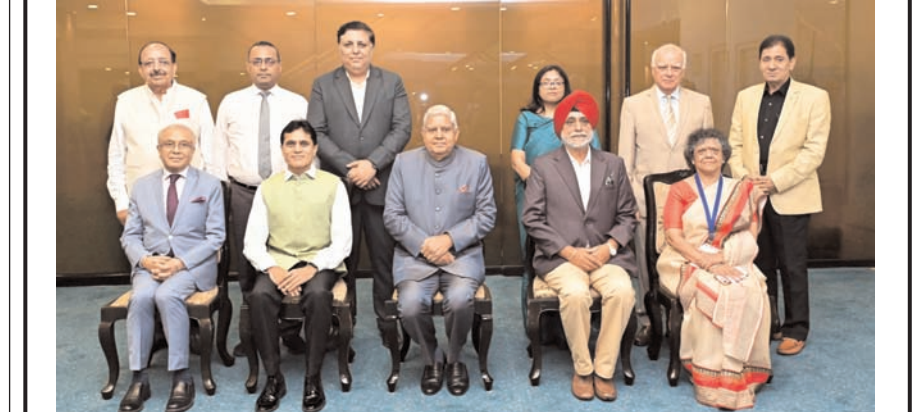
नई दिल्ली के विज्ञान भवन में ग्लोबल काउंटर टेररिज्म काउंसिल द्वारा आयोजित तीसरे साइबर सुरक्षा सम्मेलन के दौरान एक समूह तस्वीर में भारत के उपराष्ट्रपति जगदीप धनखड़।