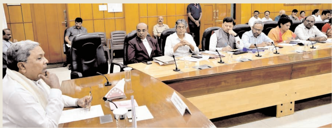
मुख्यमंत्री सिद्धरामय्या रविवार को विधानसभा सत्र पूर्व बैठक के तहत बंगलूरु में सभी विभागों के वरिष्ठ अधिकारियों के साथ बैठक को संबोधित करते हुए।