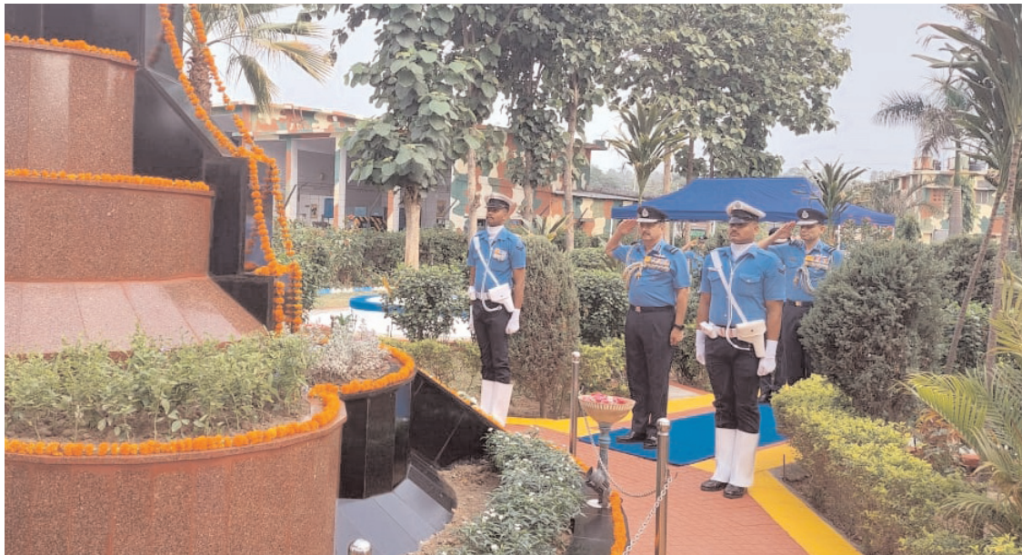
वायु सेना प्रमुख, एयर चीफ मार्शल वीआर चौधरी उत्तर प्रदेश में वायु सेना स्टेशन सरसावा में भारतीय वायु सेना (आईएफएफ) के ऑपरेशन सफेद सागर के शहीद बहादुरों को श्रद्धांजलि देते हुए।