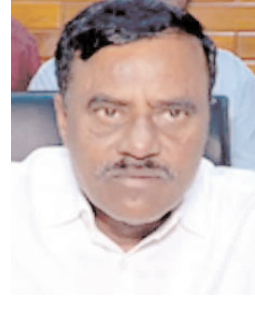
मुख्यमंत्री सिद्धरामय्या रविवार को विधानसभा सत्र पूर्व बैठक के तहत बंगलूरु में सभी विभागों के वरिष्ठ अधिकारियों के साथ बैठक को संबोधित करते हुए।

कहा कि हमने एक प्रस्ताव पारित किया है कि इस मामले को मुख्यमंत्री के संज्ञान में लाया जाए। हमने बोर्ड में प्रस्ताव रखा है कि सरकार को टिकट की कीमतों में 15-20 प्रतिशत की वृद्धि की अनुमति देनी चाहिए, ताकि हम चीजों को संचार रूप से चला सकें। हम देखेंगे कि मुख्यमंत्री क्या निर्णय लेते हैं, लेकिन यदि इस दिशा में कदम नहीं उठाया गए, तो निगम घाटे में रहेगा। उन्होंने कहा कि निगम बंद होने की कगार पर पहुंच सकता है। जहां तक शक्ति योजना का सवाल है, हमें इसका पैसा सरकार से मिलना है, लेकिन कुछ चीजें ऐसी हैं, जिनके लिए हम सरकार पर निर्भर नहीं रह सकते। अगर इस निगम को चलाना है, तो हमें भी कुछ पैसे कमाने होंगे, इसलिए हम सीएम से अपील कर रहे हैं। कोई कारण नहीं है कि शक्ति योजना के कारण कीमतों में बढ़ोतरी की जाए। 2019 से कोई संशोधन नहीं हुआ है, इसलिए हम किराया बढ़ाने का अनुरोध कर रहे हैं।