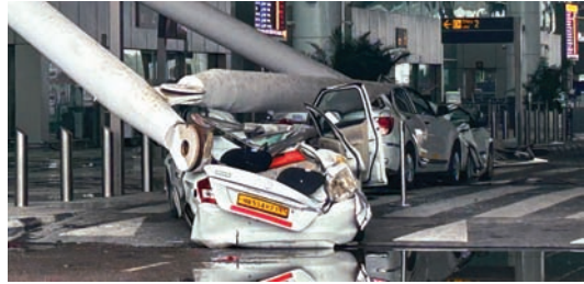
घटना की उच्च स्तरीय जांच करने के निर्देश

नई दिल्ली/एजेन्सी। राष्ट्रीय राजधानी में शुक्रवार को भारी बारिश के कारण इंदिरा गांधी अंतर्राष्ट्रीय हवाई अड्डे के टर्मिनल 1 (टी1) की छत का हिस्सा ढह गया जिससे एक व्यक्ति की मौत हो गयी और छह अन्य घायल हो गये। नागरिक उड्डयन मंत्री के. राममोहन नायडू ने घटना की जानकारी मिलते ही अधिकारियों से बात की और एक्स पर सुबह सात बजे अपनी पोस्ट में लिखा, टर्मिनल-1 दिल्ली हवाई अड्डे पर छत गिरने की घटना की व्यक्तिगत रूप से निगरानी कर रहा हूँ। प्रथम उत्तरदाता साइट पर काम कर रहे