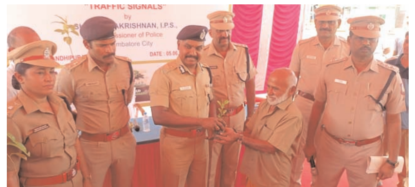
कोयंबटूर में बुधवार को विश्व पर्यावरण दिवस के मौके पर नगर पुलिस आयुक्त वी बालकृष्णन ने शहर के विभिन्न सरकलों पर लोगों को पौधे वितरित किए। लगभग 500 से अधिक पौधे वितरित किए गए।