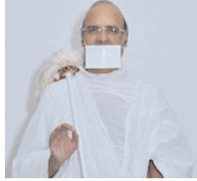
निरंतर भटक रही है। श्रद्धा दृढ़ रहती तो मोक्षपथी में टिकता। ठीक उसी प्रकार जैसे ज्योत में ज्योत बन लीन हो जाती है। उन्होंने कहा दही