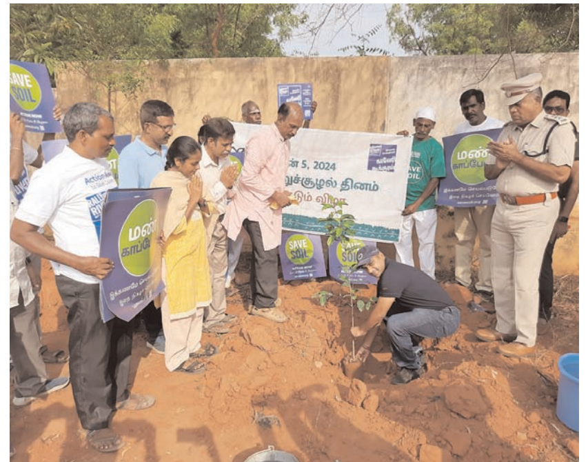
ईशा के कावेरी आह्वान अभियान के तहत पुडुचेरी में 1,50,00 पेड़ लगाए जाएंगे। वरिष्ठ पुलिस अधीक्षक नारा चैतन्य ने पहला पौधा लगाया और कार्यक्रम का उद्घाटन किया। इस वर्ष, ईशा के कावेरी आह्वान अभियान से पुडुचेरी में कृषि भूमि पर 150,000 पौधे लगाए जाएंगे। विश्व पर्यावरण दिवस से पहले दिन बुधवार को शुभारंभ कार्यक्रम हुआ। ईशा की कावेरी आह्वान पहल का लक्ष्य वित्तीय वर्ष 2024-25 के दौरान तमिलनाडु और पुडुचेरी में 12.1 मिलियन पेड़ लगाना है।