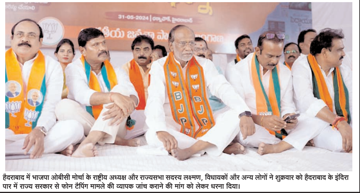
हैदराबाद में भाजपा ओबीसी मोर्चा के राष्ट्रीय अध्यक्ष और राज्यसभा सदस्य लक्ष्मण, विधायकों और अन्य लोगों ने शुक्रवार को हैदराबाद के इंदिरा पार में राज्य सरकार से फोन टैपिंग मामले की व्यापक जांच कराने की मांग को लेकर धरना दिया।