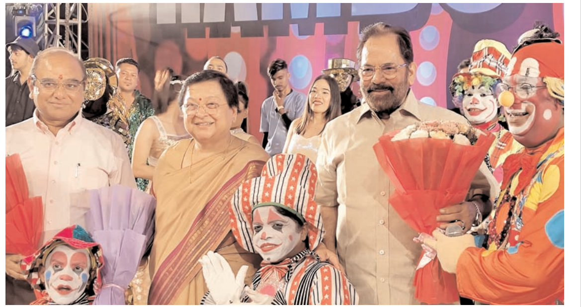
नई दिल्ली में भाजपा नेता मुख्तार अब्बास नकवी शुक्रवार को नई दिल्ली में प्रसिद्ध रेम्बो सर्कस द्वारा आयोजित अंतर्राष्ट्रीय सर्कस महोत्सव के उद्घाटन पर।