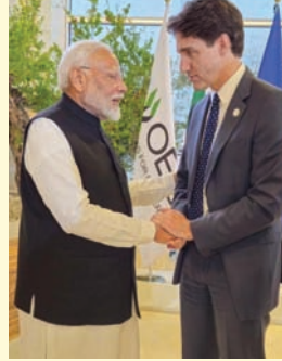
प्रधानमंत्री जस्टिन ट्रूडो से मुलाकात की। दक्षिणी इटली के अपुलिया में

बारी (इटली)/भाषा। द्विपक्षीय संबंधों में तनाव के बीच, कनाडा के प्रधानमंत्री जस्टिन ट्रूडो ने शनिवार को कहा कि जी7 शिखर सम्मेलन से इतर प्रधानमंत्री नरेंद्र मोदी से उनकी मुलाकात के बाद कुछ "बहुत महत्वपूर्ण मुद्दों" से निपटने के लिए भारत के साथ मिलकर काम करने की प्रतिबद्धता है। मोदी ने शुक्रवार को दोनों नेताओं के हाथ मिलाने की एक तस्वीर सोशल मीडिया पर पोस्ट की, जिसमें कहा गया है, "जी7 शिखर सम्मेलन में कनाडा के