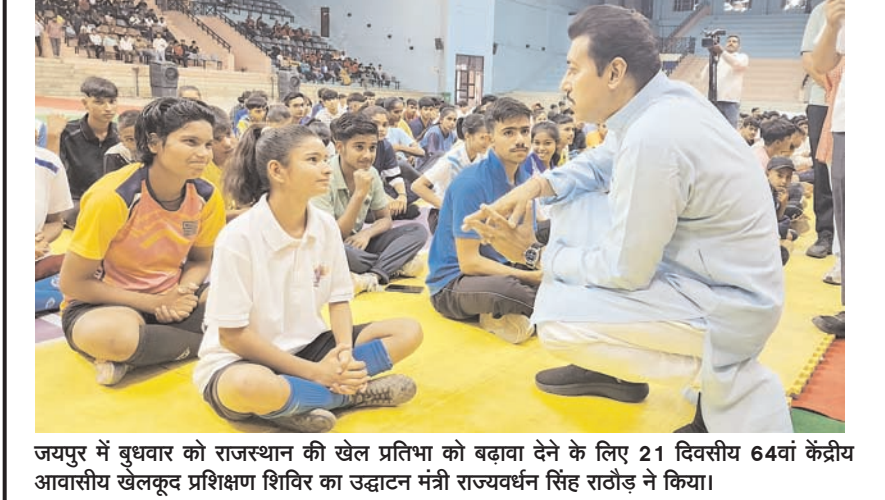
जयपुर में बुधवार को राजस्थान की खेल प्रतिभा को बढ़ावा देने के लिए 21 दिवसीय 64वां केंद्रीय आवासीय खेलकूद प्रशिक्षण शिविर का उद्घाटन मंत्री राज्यवर्धन सिंह राठौड़ ने किया।