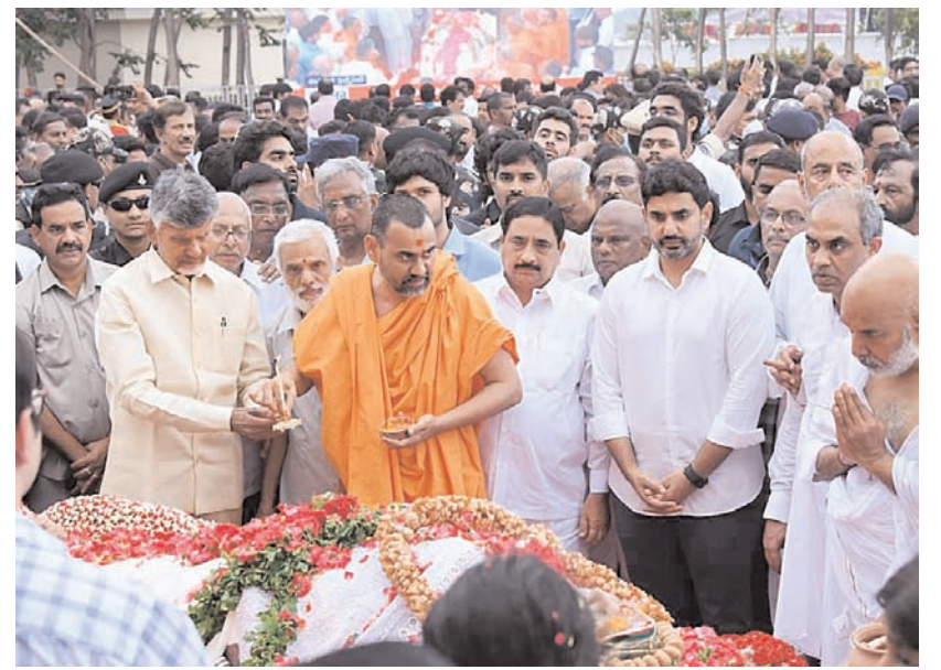
टीडीपी प्रमुख एन चंद्रबाबू नायडू और उनके बेटे और टीडीपी महासचिव नारा लोकेश ने रविवार को हैदराबाद में रामोजी फिल्म सिटी के संस्थापक रामोजी राव को श्रद्धांजलि देते हुए।