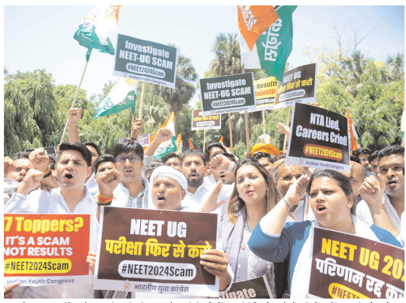
भारतीय युवा कांग्रेस के कार्यकर्ता रविवार को नई दिल्ली में एनईईटी घोटाले के विरोध में प्रदर्शन के दौरान नारे लगाते हुए।