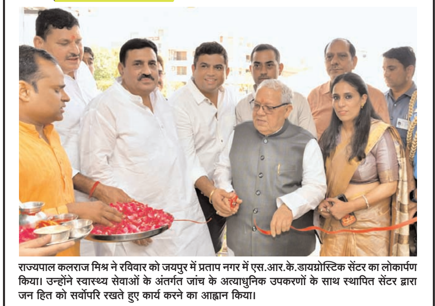
राज्यपाल कलराज मिश्र ने रविवार को जयपुर में प्रताप नगर में एस.आर.के. डायग्नोस्टिक सेंटर का लोकार्पण किया। उन्होंने स्वास्थ्य सेवाओं के अंतर्गत जांच के अत्याधुनिक उपकरणों के साथ स्थापित सेंटर द्वारा जन हित को सर्वोपरि रखते हुए कार्य करने का आह्वान किया।