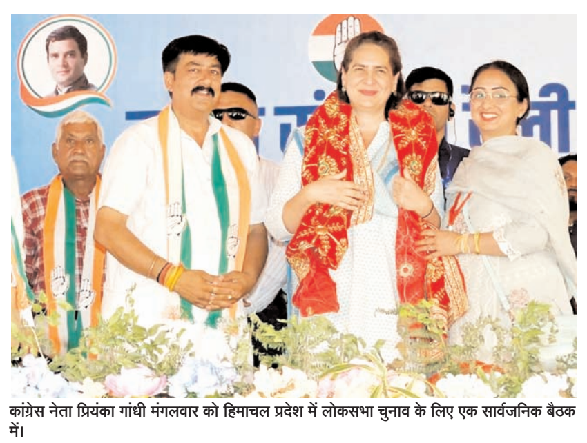
कांग्रेस नेता प्रियंका गांधी मंगलवार को हिमाचल प्रदेश में लोकसभा चुनाव के लिए एक सार्वजनिक बैठक में।