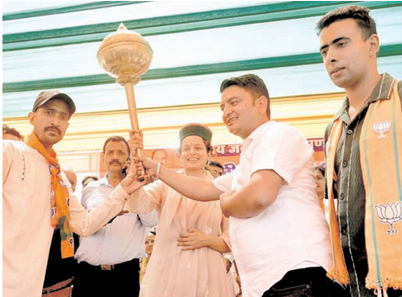
मंडी लोकसभा सीट से भाजपा उम्मीदवार कंगना रानौत मंगलवार को हिमाचल प्रदेश के कोटली में आम चुनाव 2024 के लिए एक सार्वजनिक बैठक में।