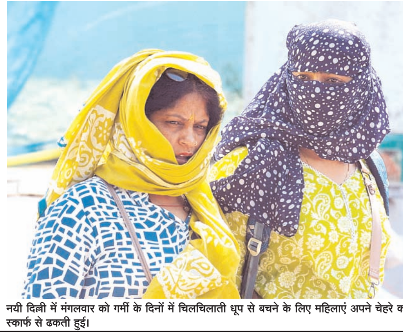
नयी दिल्ली में मंगलवार को गर्मी के दिनों में धिलचिलाती धूप से बचने के लिए महिलाएं अपने चेहरे को स्कार्फ से ढकती हुईं।